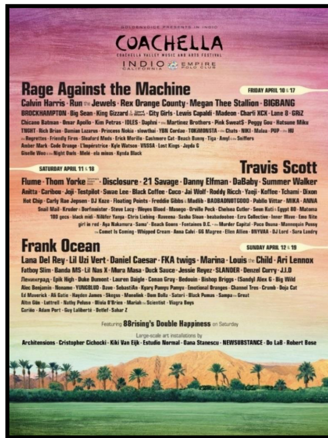
Slika 1 Raspored za Coachella festival 2020. godine