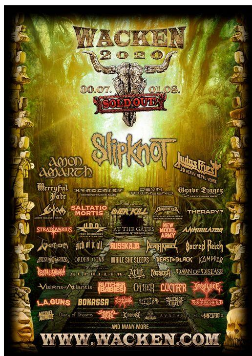
Slika 2 Rasprod za Wacken festival 2020. godine