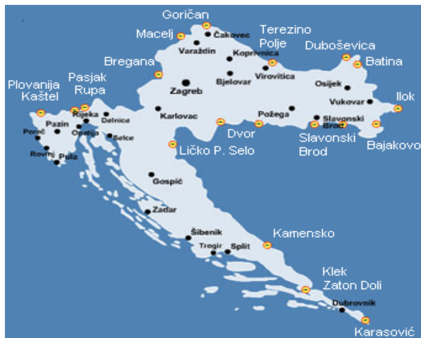
Slika 2. Granični prijelazi Republike Hrvatske

Granični prijelaz je jasno obilježeno mjesto predviđeno za prelaženje državne granice, a može biti otvoren za obavljanje međunarodnog, međudržavnog i pograničnog prometa. Granični prijelaz Republike Hrvatske za međunarodni promet obilježeno je mjesto za prijelaz državne granice hrvatskih državljana i državljana drugih država, a prijelaz za međudržavni promet mjesto određeno za prijelaz državne granice hrvatskih državljana i državljana susjedne države te je granični prijelaz za pogranični promet mjesto određeno za prijelaz državne granice hrvatskih državljana s određenog područja Republike Hrvatske i državljana susjedne države, sukladno međudržavnom sporazumu (Grobenski, S., Jakopović, E., 2018.). Prikaz svih važnih graničnih prijelaza Republike Hrvatske daje se na Slici 2.