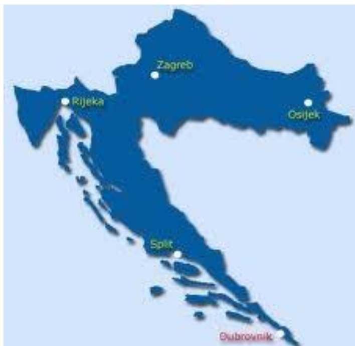
Slika 1. Prikaz državne granice Republike Hrvatske