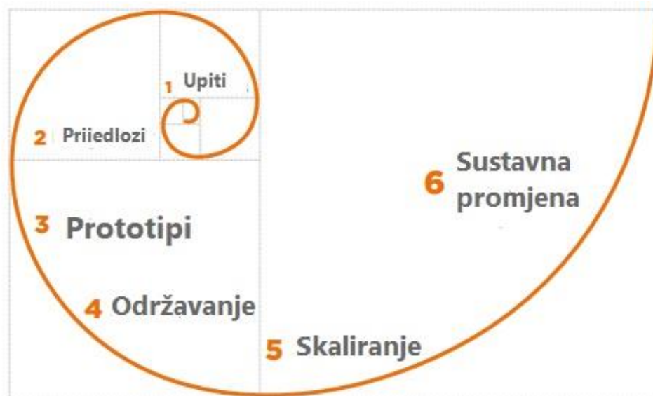
Slika 1. Proces društvenih inovacija