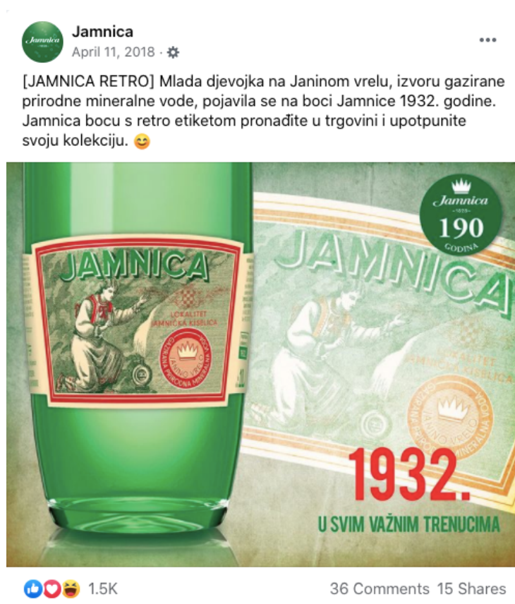
Slika 16. Objava retro etikete iz 1932. godine