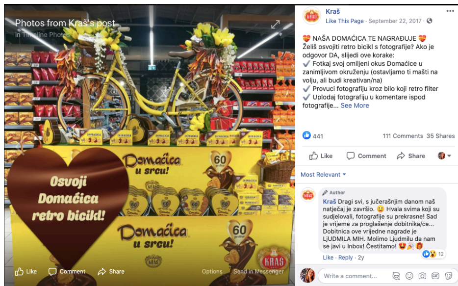
Slika 25. Objava nagradnog natječaja Domaćice na Facebooku