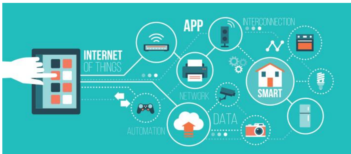
Slika 4. Elementi Interneta stvari