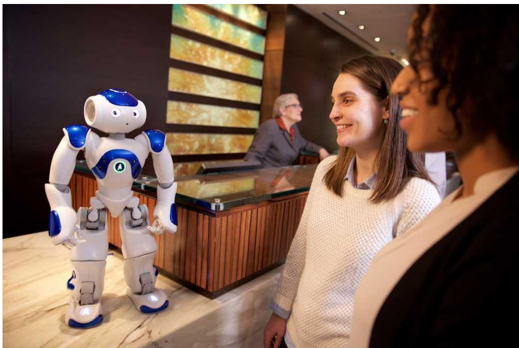
Slika 2. Roboti u hotelijerstvu