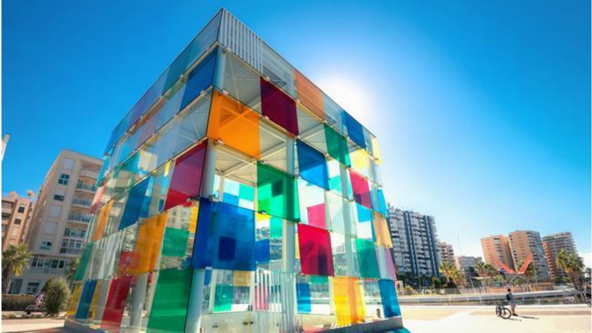
Slika 6. Malaga kao pametna destinacija

odluka bila je transformacija užeg centra ugodnijeg za pješake, fokus na održivi razvoj kao i prihvaćanje IT scene koja je svoja rješenja implementirala u Malagi.