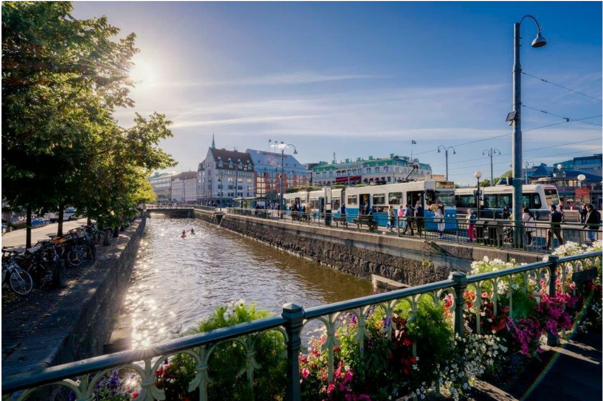
Slika 5. Göteborg kao pametna destinacija

da od pametnih pređena pametnije. Svijet traži nove, održive načine za iskorištavanje rastućeg turističkog sektora.