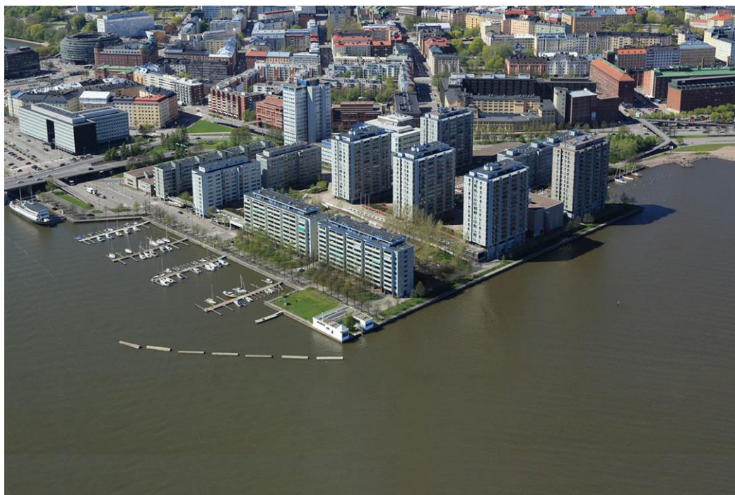
Slika 7. Helsinki kao pametna destinacija