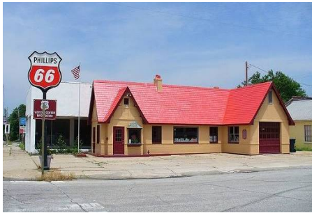
Slika 11. Benzinska postaja Baxter Springs u Kansasu