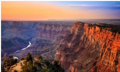
Slika 12. Nacionalni park Grand Canyon

https://www.smartertravel.com/planning-a-trip-to-the-grand-canyon/ (27.04.2021.)