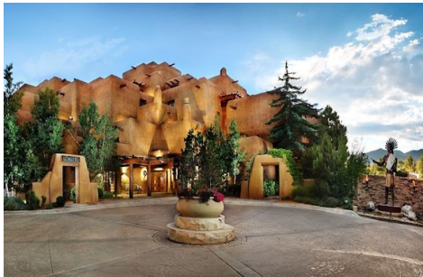
Slika 21. Gostionica i spa u Santa Feu u Novom Meksiku