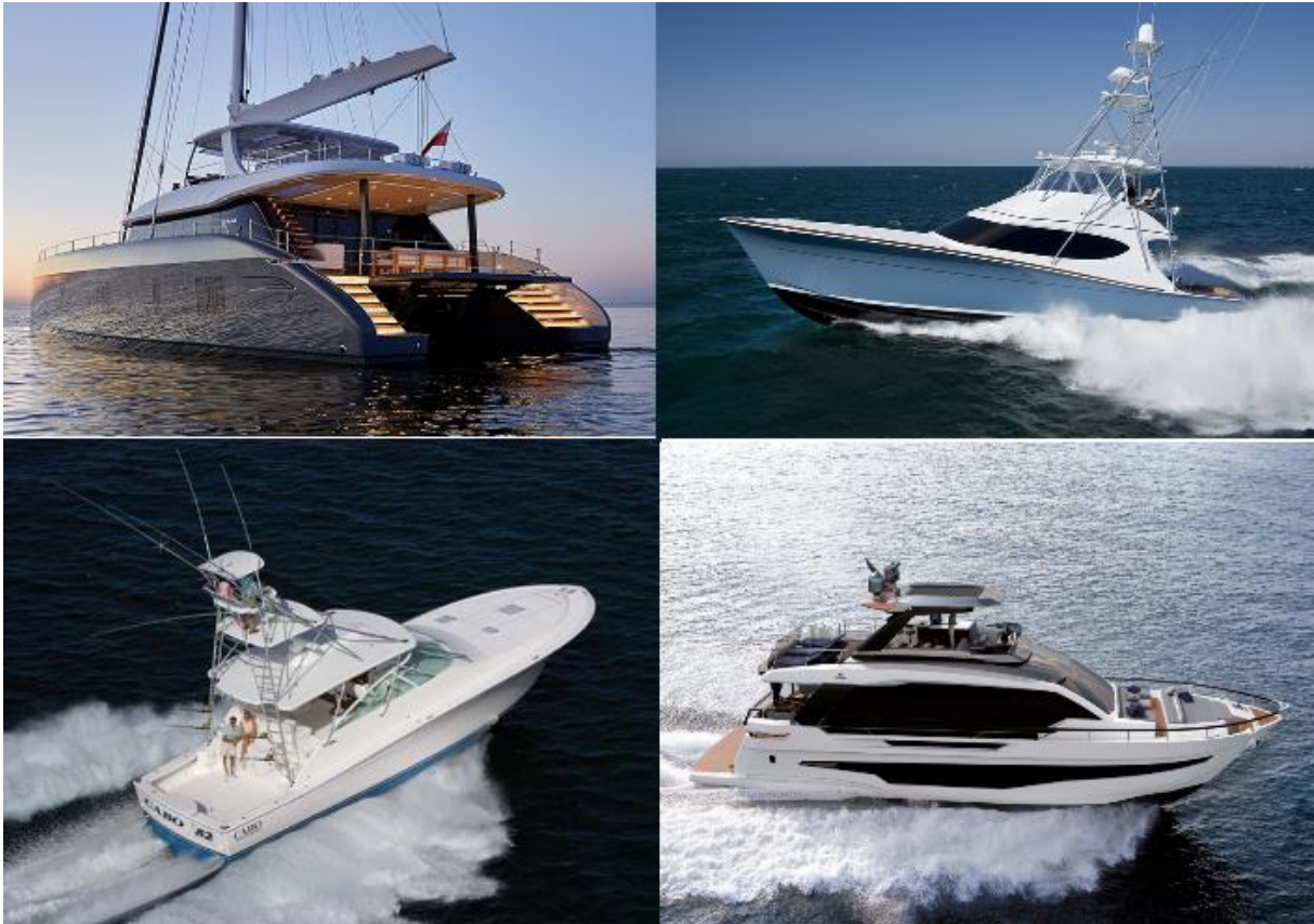
Slika 3: Vrste jahti