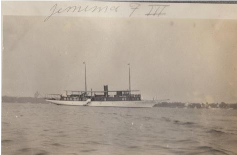
Slika 4: Jemima F. III - najveća jahta 1908. godine