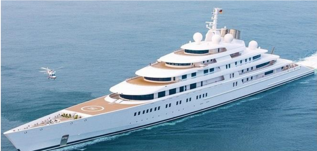
Slika 5: Najveća jahta na svijetu - Azzam