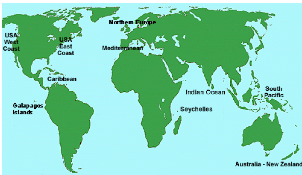
Slika 2: Najpopularnije cruising destinacije u svijetu