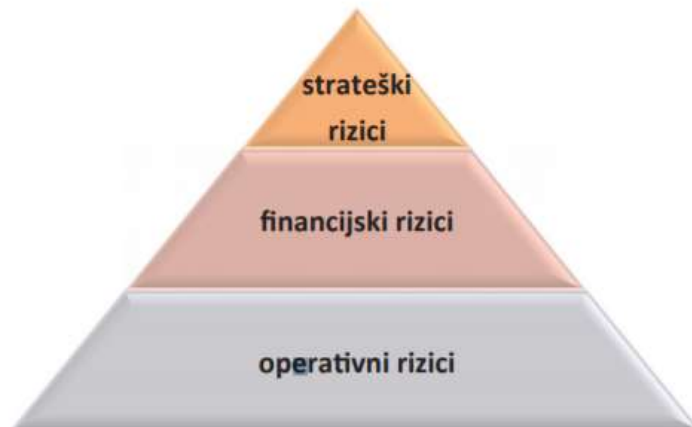
Slika 2 Piramida upravljanja rizicima