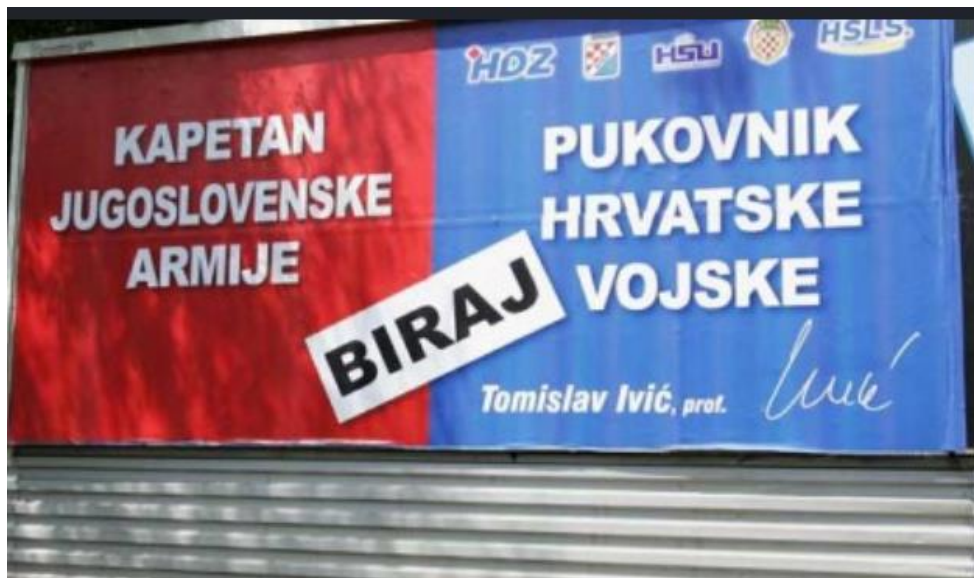
Slika 6. Oglas političke stranke Hrvatska Demokratska Zajednica