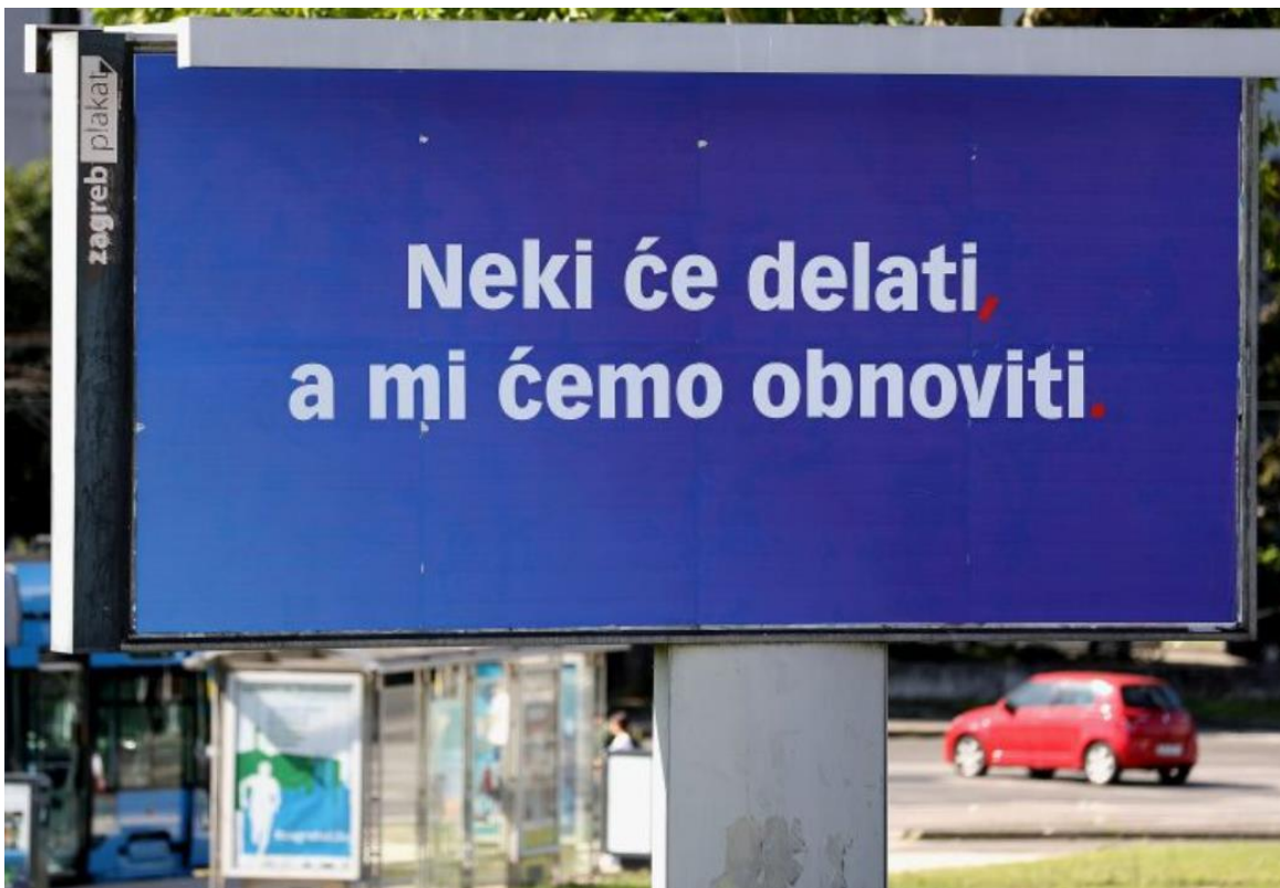
Slika 2. Primjer implicitnog komparativnog oglašavanja u političkim kampanjama

Primjer implicitnog komparativnog oglašavanja u političkim kampanjama može se vidjeti na Slici 2. gdje politička stranka - Hrvatska Demokratska Zajednica , koja sponzorira oglas, vrši komparativno oglašavanje usmjereno konkurentskoj političkoj stranci ne koristeći eksplicitno naziv konkurentске stranke, već frazu koja se povezuje uz tu stranku, čime ona postaje razlikovna karakteristika. Prema gore navedenim definicijama komparativnog oglašavanja, takvo oglašavanje koristi bazu uspoređivanja koja je izričito jasna potrošačima, odnosno u ovom slučaju biračima, gdje u ovom primjeru, bazu uspoređivanja predstavlja fraza, odnosno glagol koji je jasno poznat biračima i mogu ga povezati izričito uz jednu političku stranku - Milan Bandić 365 , zbog poznate izjave političkog kandidata Milana Bandića “idemo delati”. Iako Hrvatska Demokratska Stranka nije navela svoje ime na oglasu, birači jasno mogu zaključiti da se radi o toj stranci zbog korištenja prepoznatljivih boja - pretežno plave s crvenim i bijelim detaljima, koje su simbol Hrvatske Demokratske Zajednice.