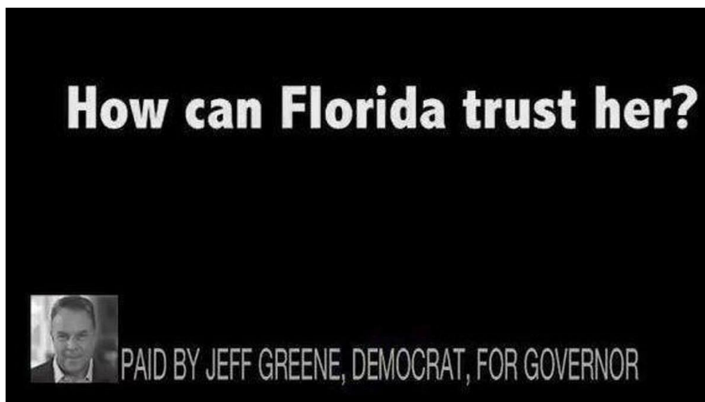
Slika 3. Primjer implicitnog komparativnog oglašavanja u političkim kampanjama

Na slici 3. prikazan je primjer implicitnog komparativnog oglašavanja u političkim kampanjama, točnije radi se o oglasu sponzoriranom od strane kandidata za guvernera Floride 2018. godine. Radi se o implicitnom komparativnom oglasu iz razloga što kandidat ne navodi eksplicitno ime i prezime protukandidatkinje Gwen Graham, ali javnost zna da se misli na nju pošto je bila jedini ženski protukandidat na navedenim izborima.