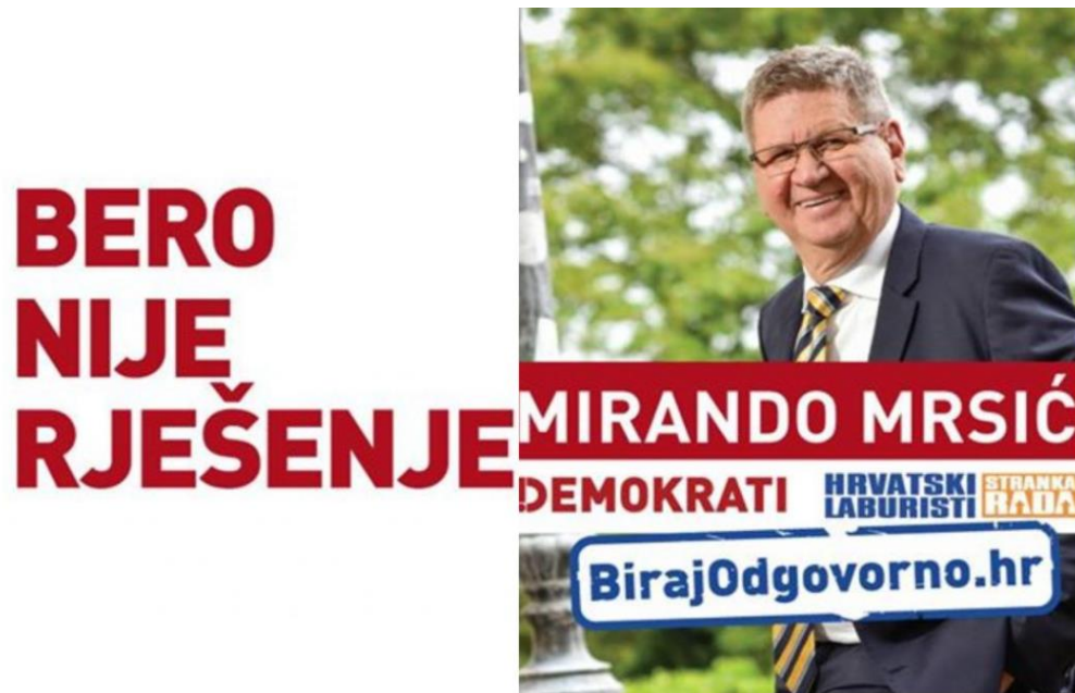
Slika 4. Politički oglas iz kampanje Miranda Mrsića i pripadajuće političke koalicije