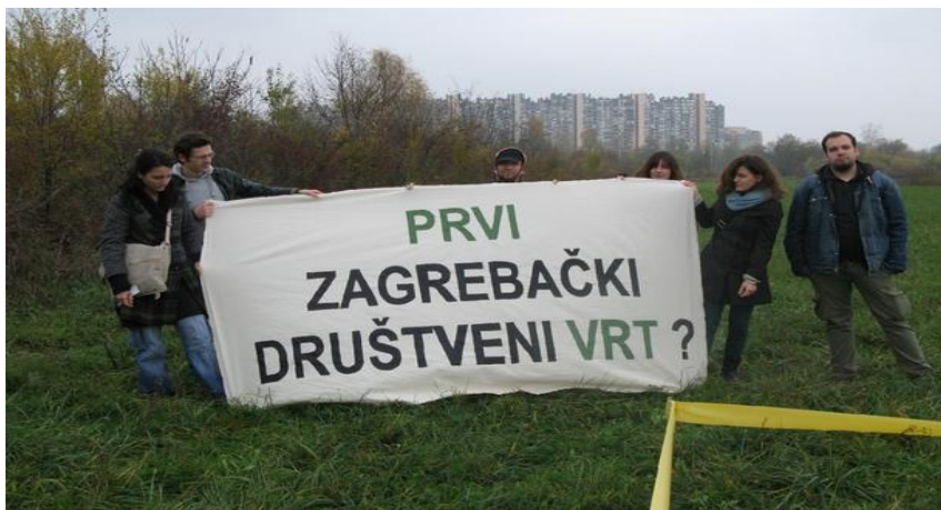
Slika 8. Transparent inicijative Parkticipacija u Zagrebu