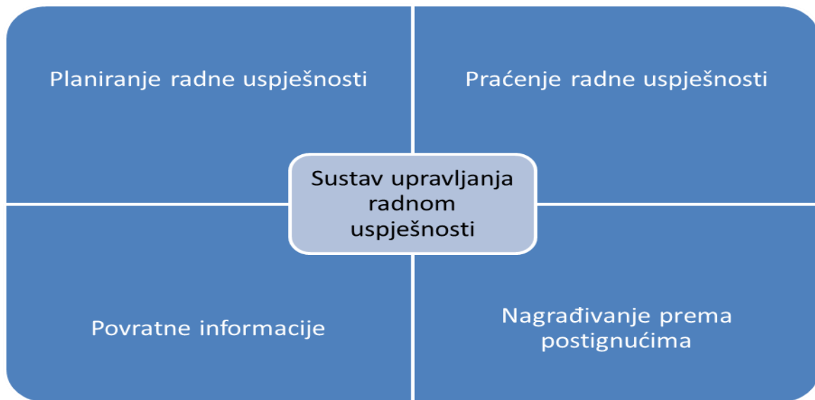
Grafikon 2. Ključne dimenzije sustava upravljanja radnom uspješnošću