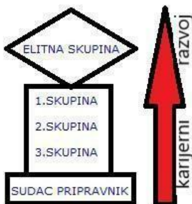
Slika 1. Kategorizacija i hijerarhija sudačkih skupina prema HNS-u