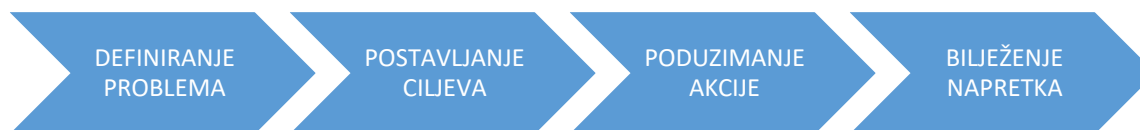
Slika 3. Četiri ključna koraka kod upravljanja sindromom sagorijevanja