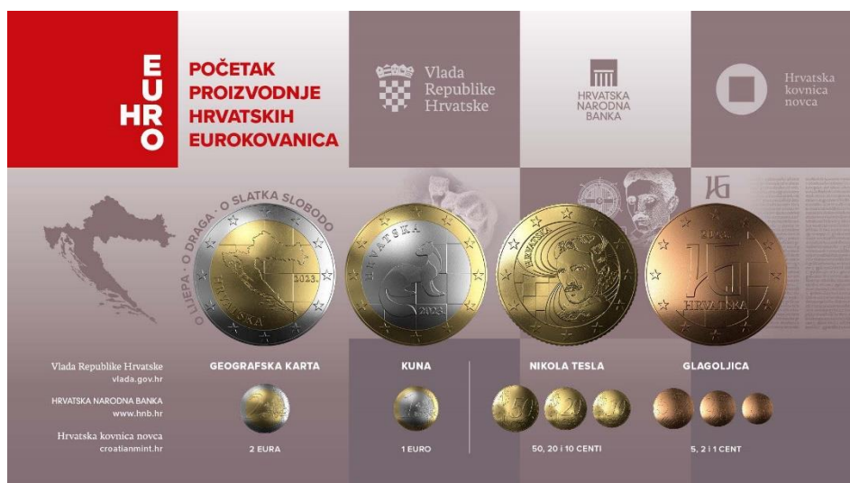
Slika 2: Izgled kovanica sa nacionalnom stranom