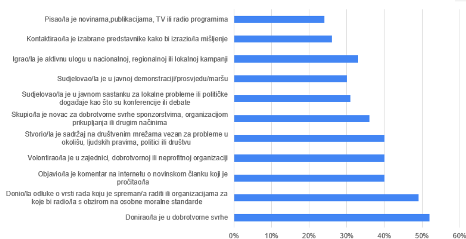
Grafikon 2. Poduzete aktivnosti generacije Z u posljednje dvije godine