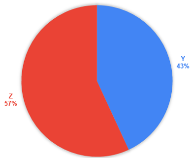
Grafikon 5. Struktura uzorka s obzirom na pripadnost generaciji Y i Z