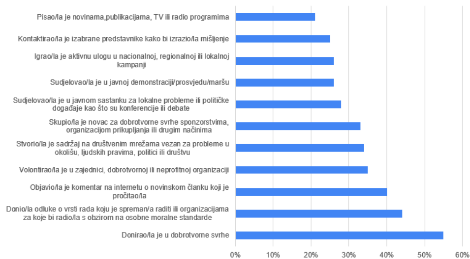
Grafikon 1. Poduzete aktivnosti generacije Y u posljednje dvije godine