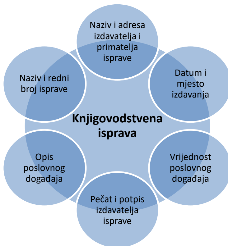
Graf 2 Osnovni elementi knjigovodstvene isprave