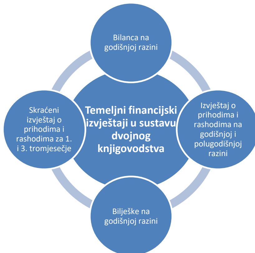
Slika 3 Financijski izvještaji neprofitnih organizacija koje vode dvojno knjigovodstvo