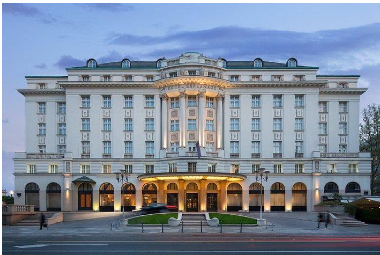
Slika 3: Hotel Esplanade

Što se tiče poslovne etike Hotela Esplanade, ona ima vrlo visoke standarde. Hotel se pridržava strogih standarda, u pogledu integriteta, poštenja i profesionalnosti u svojim poslovnim aktivnostima. Provodi politike i procedure koje promiču poštene i etičke prakse u svim aspektima svoga poslovanja. To uključuje usklađenost sa zakonima i propisima i poštivanje ljudskih prava i dostojanstva svih zaposlenika i gostiju.