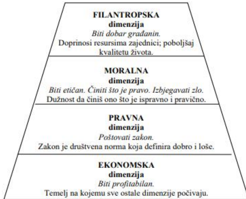
Slika 1: Vrste društvene odgovornosti