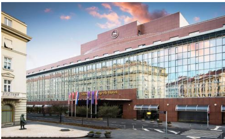
Slika 5: Hotel Sheraton, Zagreb

Uprava hotela je zadužena za stvaranje pozitivnog utjecaja na zajednicu, okoliš i zaposlenike te ona osigurava da svi poslovni postupci budu u skladu sa najvišim etičkim standardima. Hotel je osnovao globalni program za društvenu odgovornost koji se zove „Serve 360“. Četiri ključna područja ovog programa su: održivost, poslovanje, radno mjesto i zajednica. Cilj ovog programa je da Sheraton surađuje s lokalnom zajednicom i organizacijama kako bi podržao inicijative koje promiču održivost, društvenu pravdu i obrazovanje.