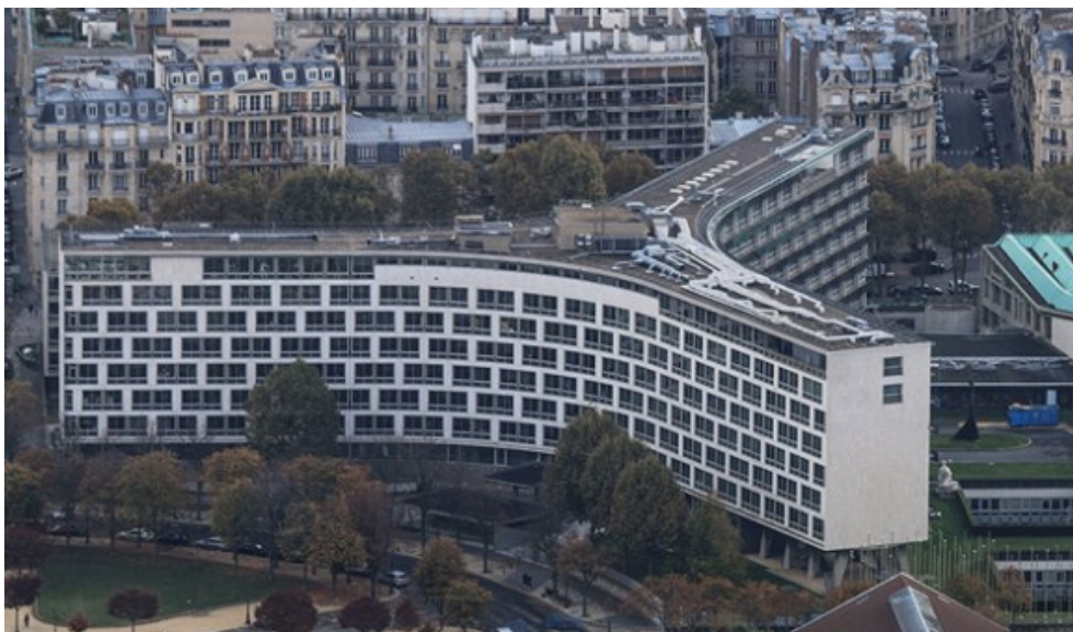
Slika 2: Kuća UNESCO-a