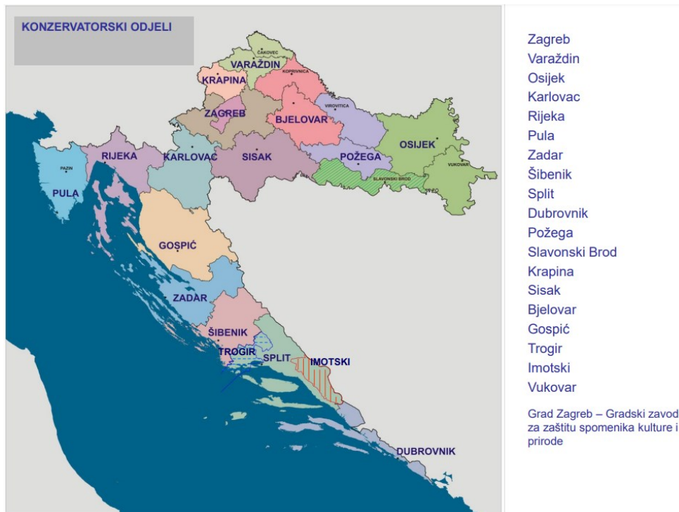
Slika 7: Konzervatorski odjeli ministarstva kulture