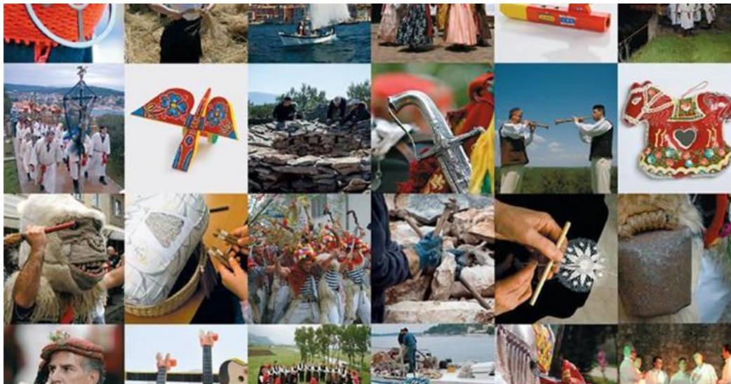
Slika 5: Očuvanje kulturne baštine