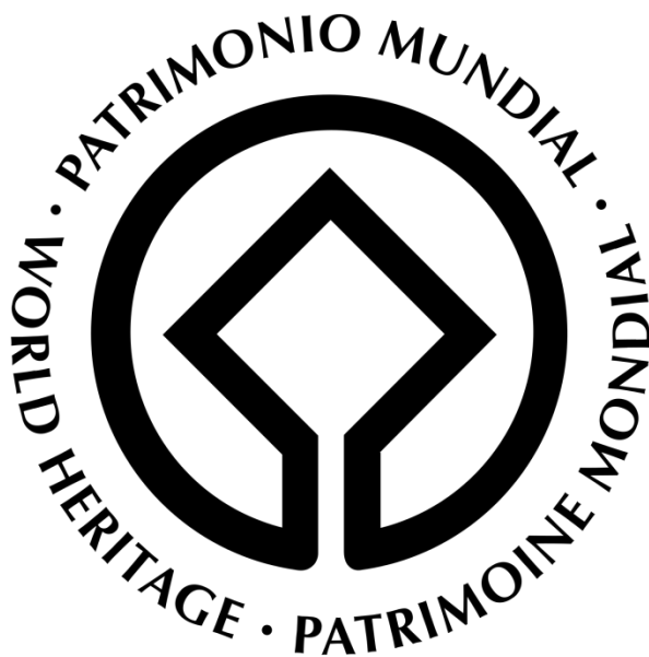
Slika 4: Logo Konvencije