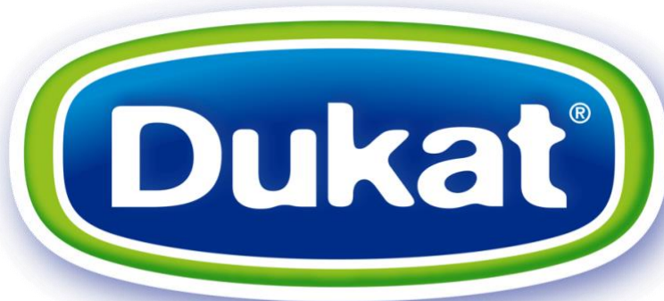
Slika 3 Dukat - logo