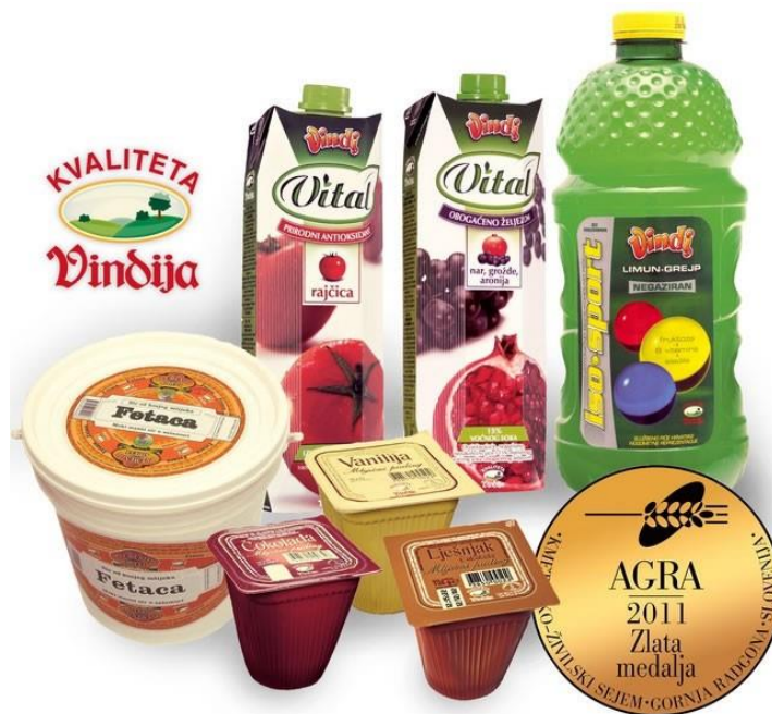
Slika 4 Vindija - proizvodi