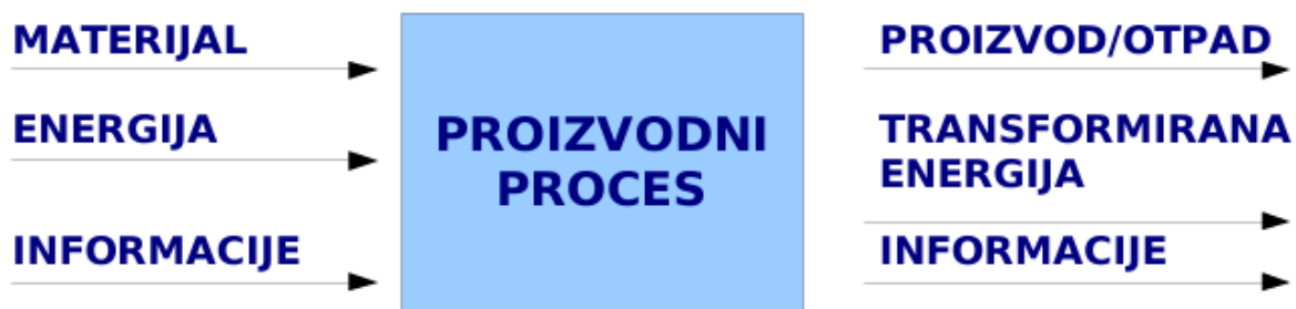
Slika 4. Shematski prikaz proizvodnog procesa

Proces proizvodnje je skup radnji uz pomoć kojih se sirovine i materijali pretvaraju u gotov proizvod zadanog svojstva prikladan za potrošnju ili daljnju upotrebu. Osnova je svake industrijske proizvodnje jer obuhvaća sva sredstva i osoblje koje je zaslužno za konačan rezultat. Tehnološki proces, transparentni proces, proces organizacije i proces informacija temeljne su sastavnice proizvodnog procesa.