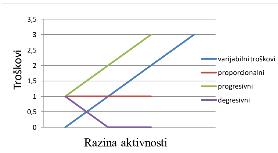
Graf 2. Proporcionalni, progresivni i degresivni varijabilni troškovi u masi i jedinici

Mješoviti troškovi dobili su naziv po tome jer imaju i fiksnu i varijabilnu komponentu što znači da se ponašaju djelomično kao fiksni, a djelomično kao varijabilni troškovi. Najveći dio troškova u praksi je upravo varijabilan. Njihov ponašanje pokazano je grafički u sljedećem grafu.