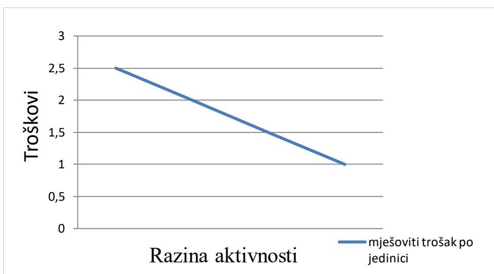
Graf 3. Primjer mješovitog troška u masi i jedinici