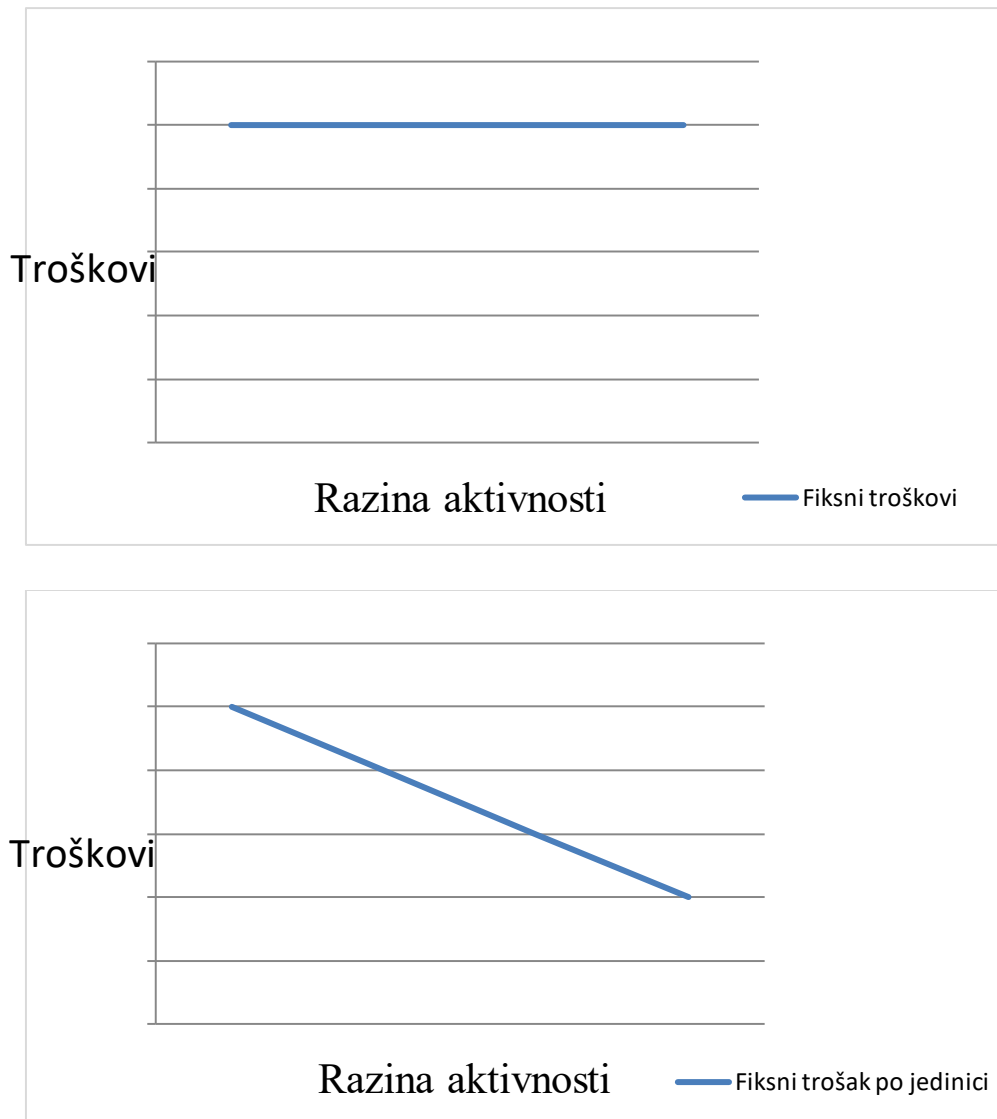
Graf 1. Fiksni troškovi u masi i po jedinici

situacija je nešto drugačija. Njihova vrijednost opada s povećanjem aktivnosti što je grafički prikazano niže.