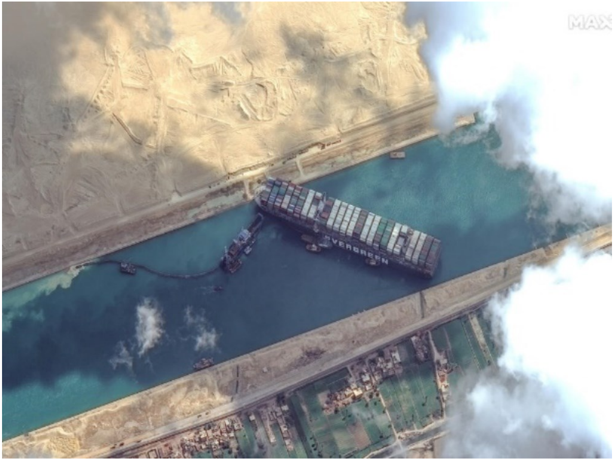
Slika 3. Satelitska slika Sueskog kanala i broda Ever Given