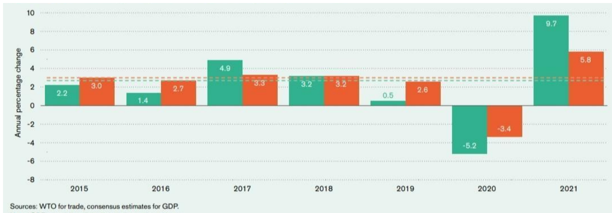
Grafikon 2. Svjetska trgovinska razmjena i rast BDP-a (2015.-2021.)

Izvor: World trade and economic growth (2023) Dostupno na: https://www.wto.org/english/res_e/booksp_e/wtsr_2022_c3_e.pdf