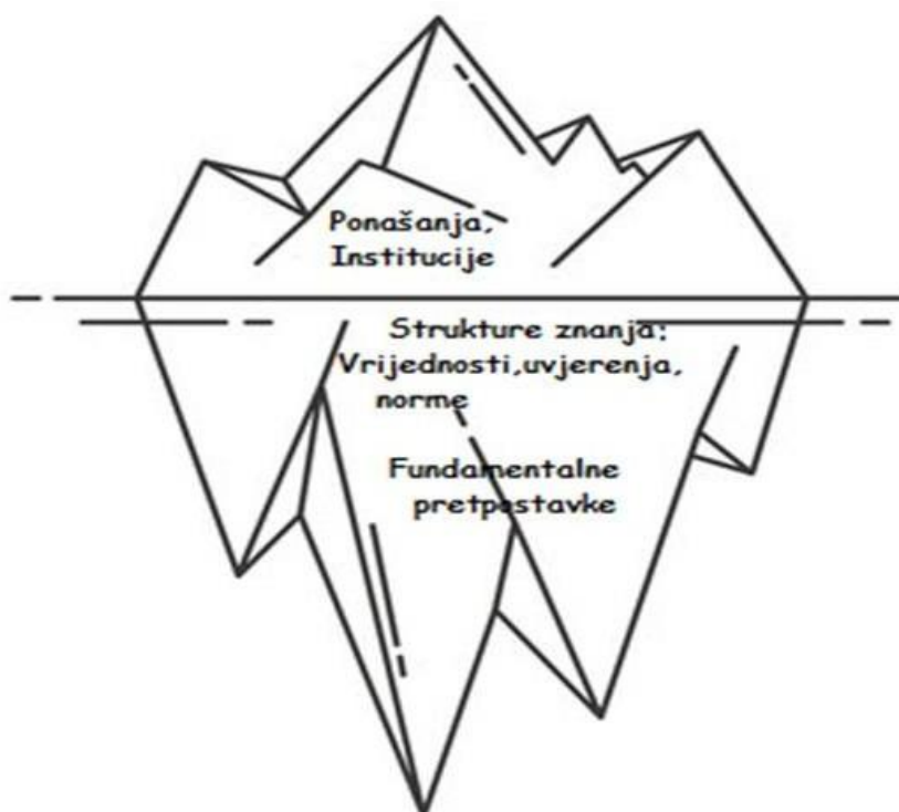
Slika 3. Kultura kroz prikaz sante leda