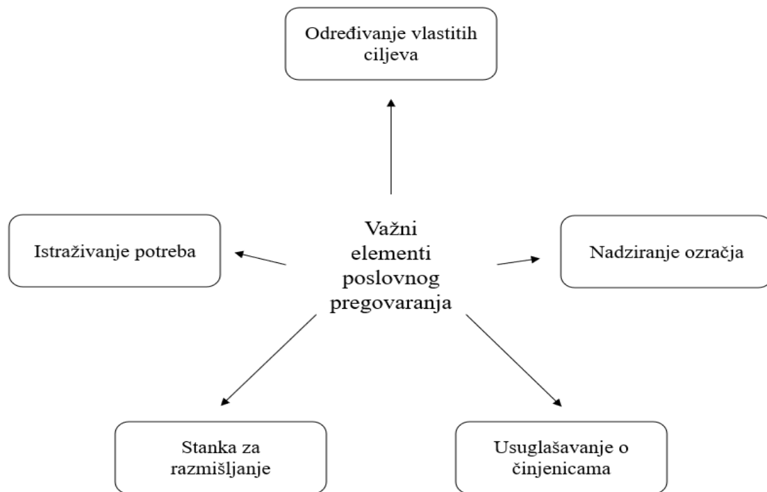
Slika 1. Važni elementi poslovnog pregovaranja