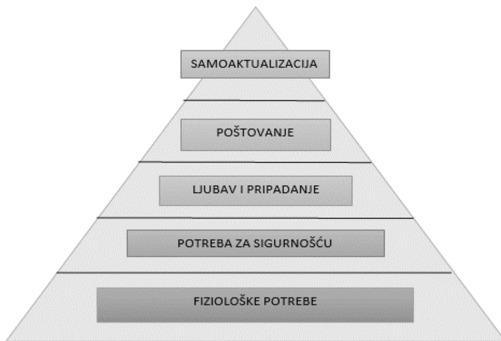
Slika 2. Maslowljeva piramida potreba

Izvor: rad autorice prema: 27. Nierenberg, J. i Ross, I. S. (2005.), Tajne uspješnog pregovaranja , Zagreb: Školska knjiga, str. 18.