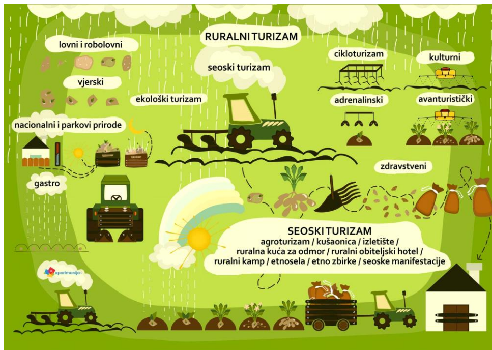
Slika 5: Odnos seoskog i ruralnog turizma