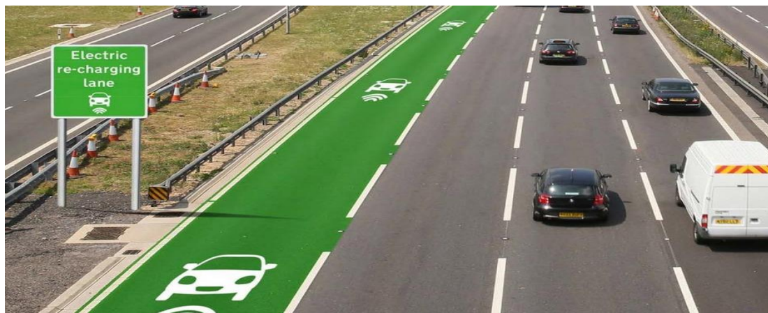
Slika 1. Prikaz punjenja električnih vozila tijekom vožnje