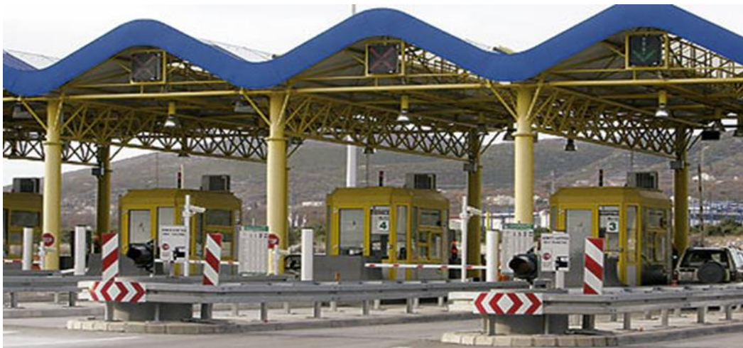
Slika 3. Naplatne kućice