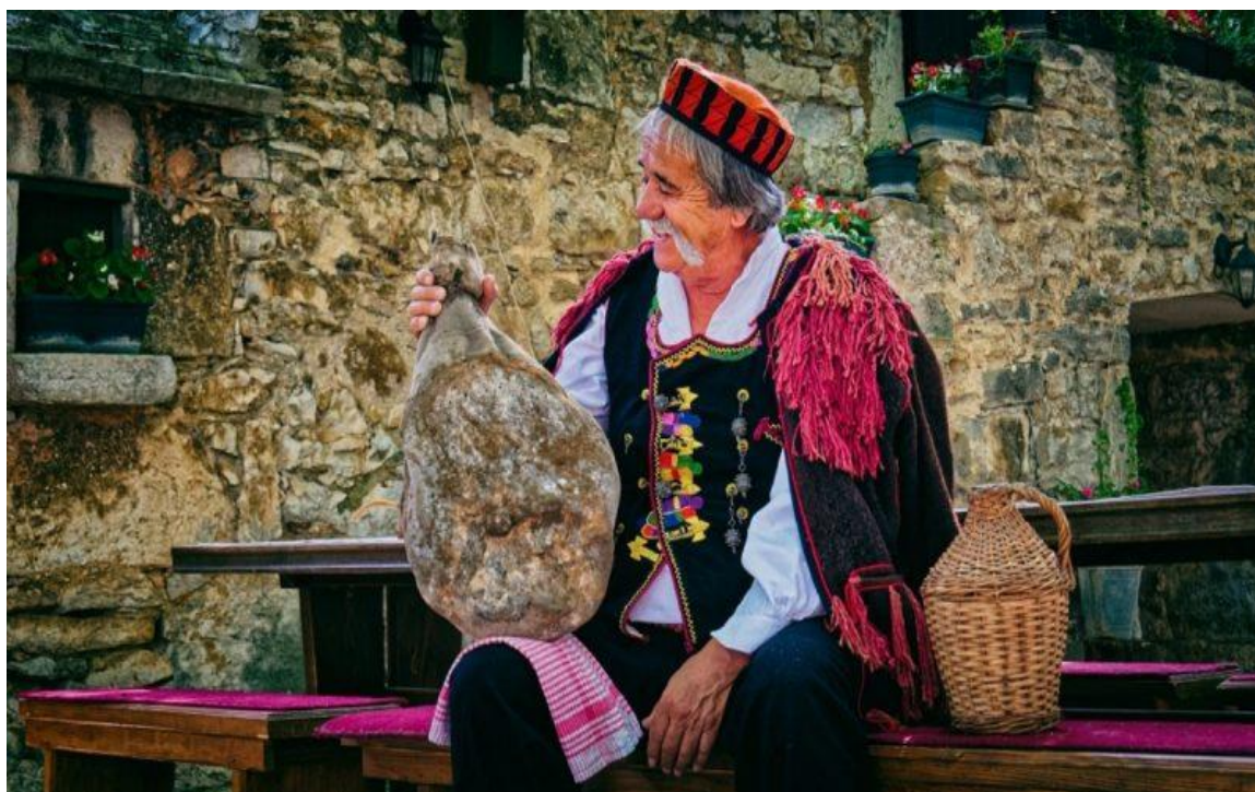
Slika 5. Međunarodni festival pršuta u Drnišu