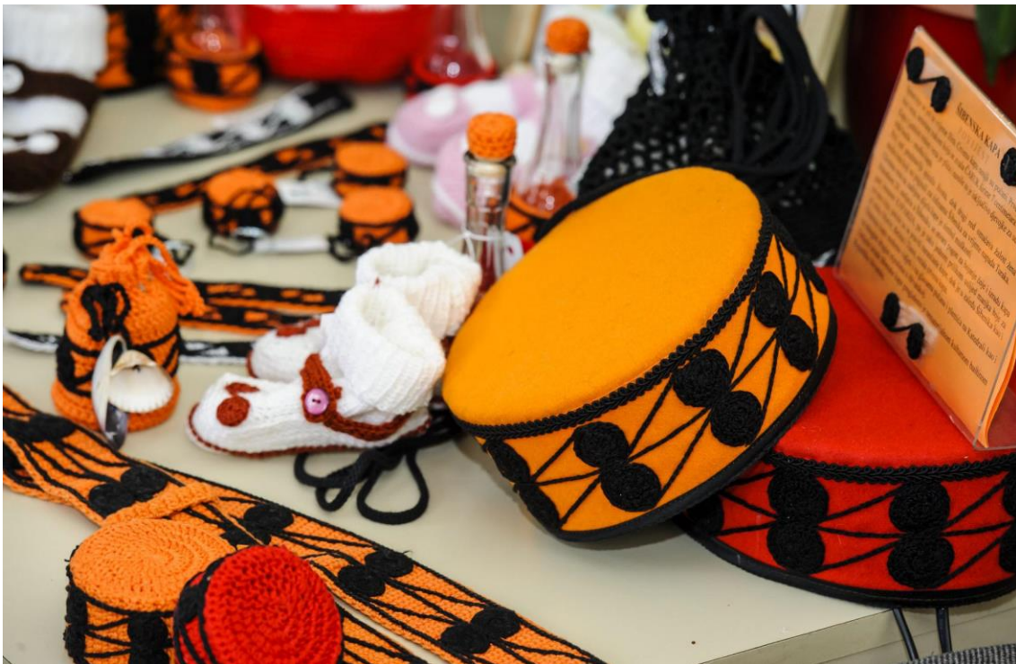
Slika 4. Suvenir Šibenska kapa