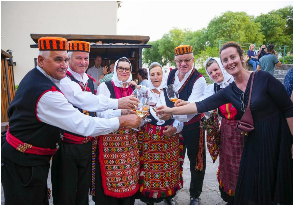
Slika 6. Festival drniškog merlota