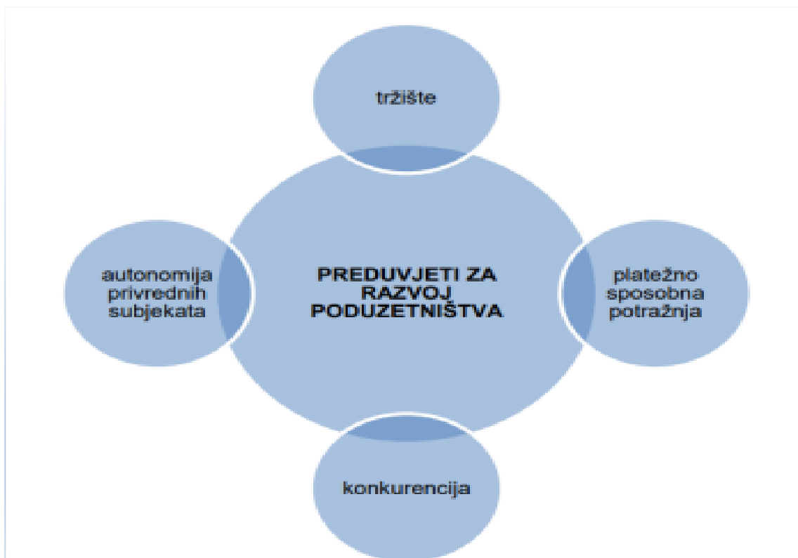
Slika 1. Osnovni preduvjeti razvoja poduzetništva