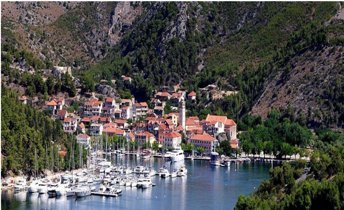
Slika 8. Panorama grada Skradina