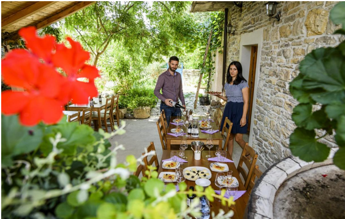
Slika 7. Kušaonica vina vinarije Sladić u Plastovu