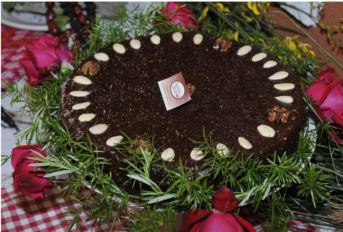
Slika 9. Izgled Skradinske torte