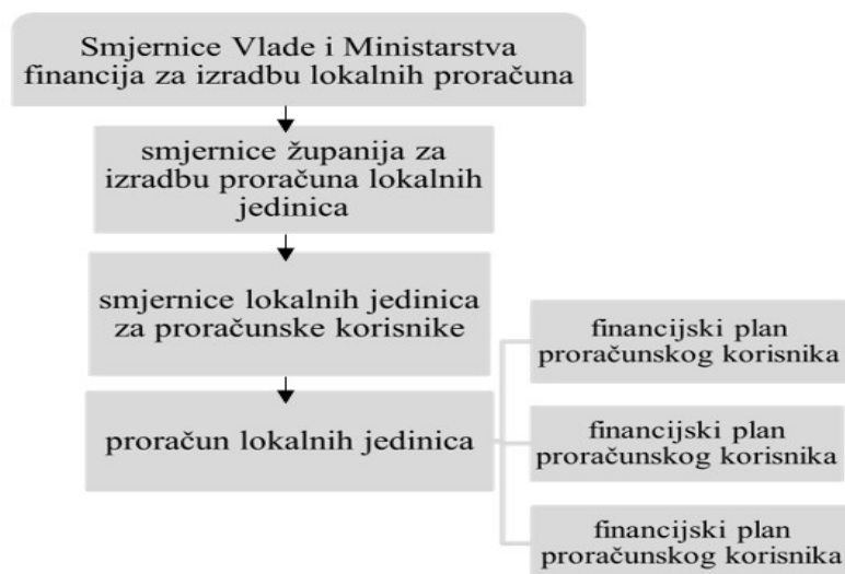
Slika 1. Planiranje proračuna lokalnih jedinica