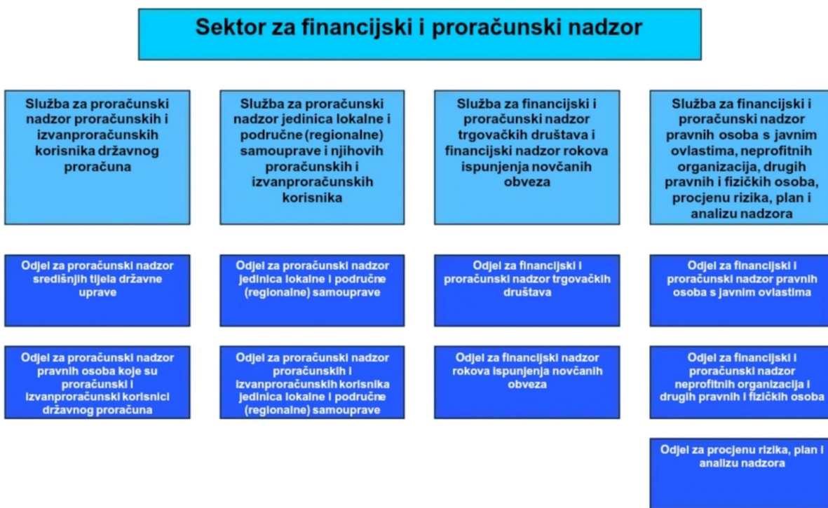
Slika 2. Sektor za financijski i proračunski nadzor