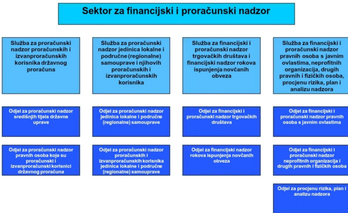
Slika 2. Sektor za financijski i proračunski nadzor