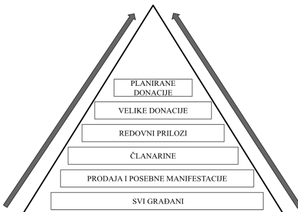
Slika 3. Izvori-načini prikupljanja sredstava i njihova veličina