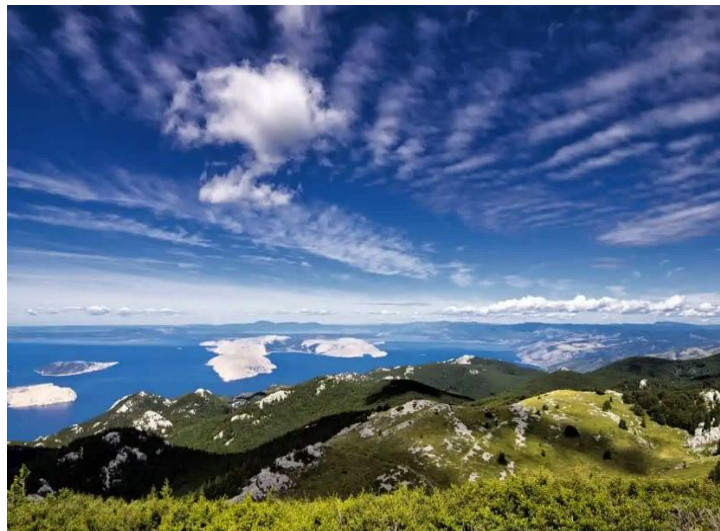
Slika 4. Velebit