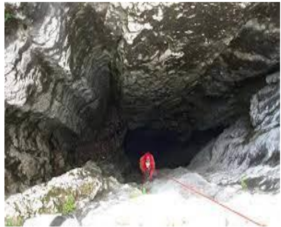
Slika 2. Špilja “Lukina jama”