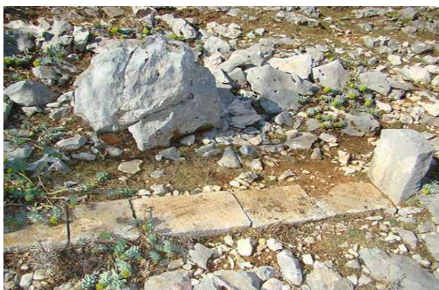
Slika 10. Mirila