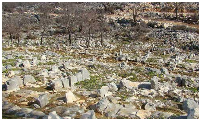
Slika 11. Mirila