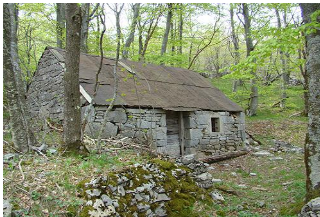
Slika 9. Pastirski stan