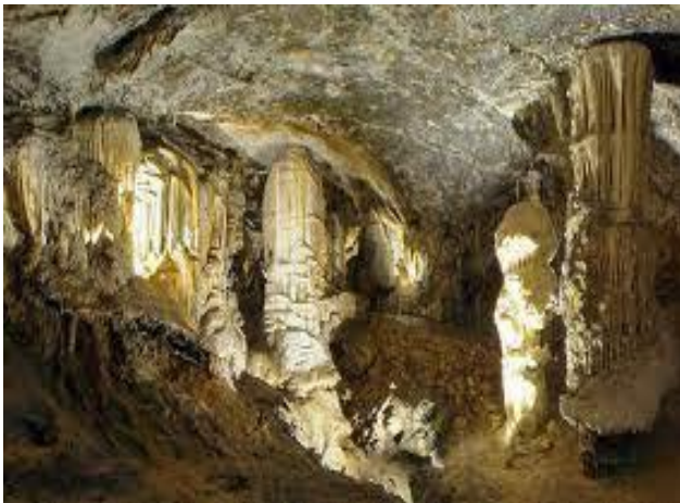
Slika 3. Špilja “Lukina jama”