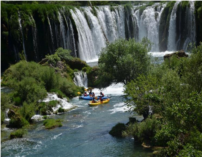
Slika 5. Slap “Visoki buk”