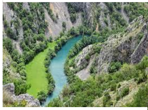
Slika 1. Kanjon rijeke Zrmanje