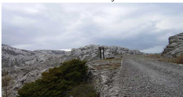
Slika 6. Terezijana