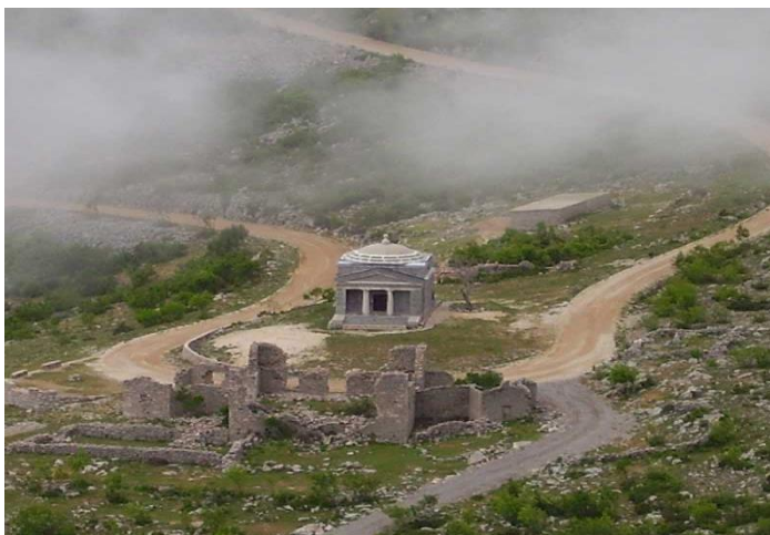
Slika 7. Majstorska cesta