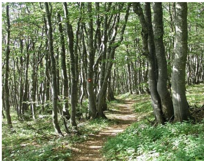
Slika 8. Premužićeva staza