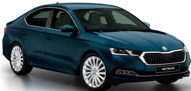
Slika 2: Najprodavaniji model vozila u Republici Hrvatskoj