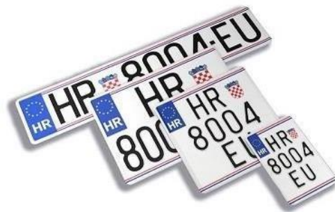
Slika 4: Vrste registracijskih oznaka u Republici Hrvatskoj