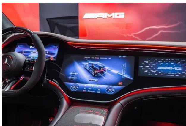
Slika 1: Infotainment sustav vozila