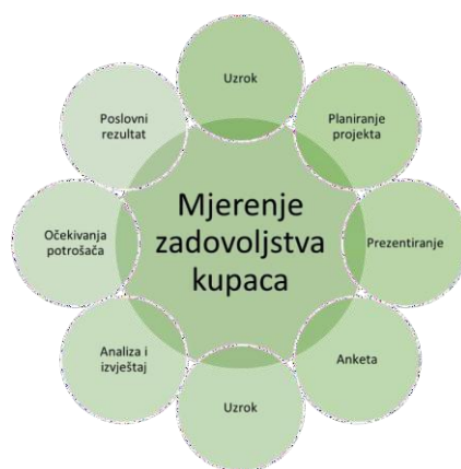
Slika 6: Proces mjerenja zadovoljstva kupaca

Sve ove čimbenike treba pažljivo upravljati kako bi se osiguralo visoko zadovoljstvo kupaca, jer zadovoljni kupci često postaju lojalni kupci i daju pozitivne preporuke. (Kompere 2020.)