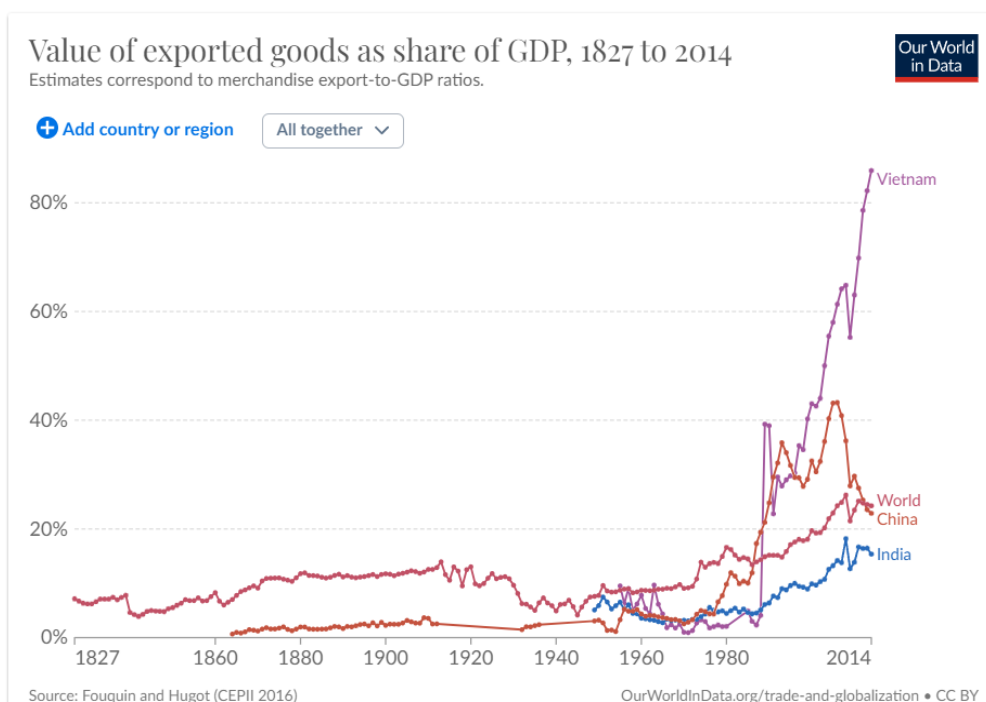
Slika 4 Vrijednost izvezenih dobara kao udio u BDP-u, od 1827. do 2014. godine.

Potencijalni rast može se ostvariti putem povećanja produktivnosti. Indija je postigla značajan napredak u digitalizaciji svoje ekonomije, što obuhvaća proširenje dostupnosti interneta i mobilnog interneta. No, još jedan ključni faktor je jedinstveni identifikacijski broj poznat kao Aadhaar, najveći biometrijski identifikacijski sustav na svijetu. Putem ovog sustava, moguće je provjeriti identitet njene 1,4 milijarde stanovnika kako online tako i fizički. Ovo omogućava precizniju isporuku javnih usluga, proširuje dostupnost kredita za manja poduzeća i stoga može doprinijeti potencijalnom rastu putem povećane produktivnosti.