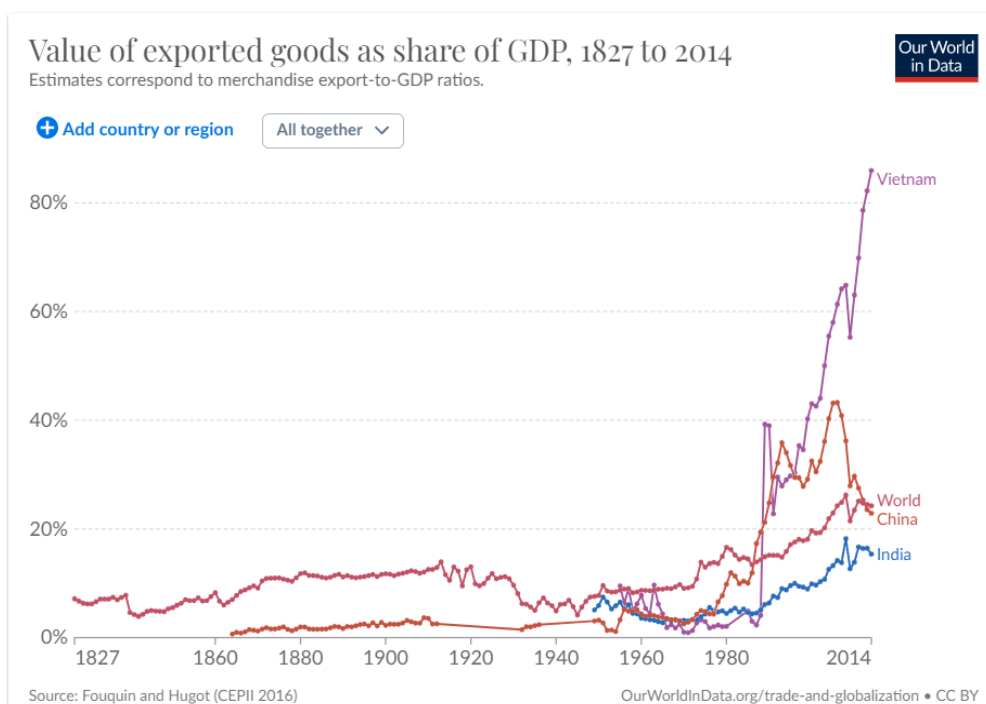
Slika 4 Vrijednost izvezenih dobara kao udio u BDP-u, od 1827. do 2014. godine.

Potencijalni rast može se ostvariti putem povećanja produktivnosti. Indija je postigla značajan napredak u digitalizaciji svoje ekonomije, što obuhvaća proširenje dostupnosti interneta i mobilnog interneta. No, još jedan ključni faktor je jedinstveni identifikacijski broj poznat kao Aadhaar, najveći biometrijski identifikacijski sustav na svijetu. Putem ovog sustava, moguće je provjeriti identitet njene 1,4 milijarde stanovnika kako online tako i fizički. Ovo omogućava precizniju isporuku javnih usluga, proširuje dostupnost kredita za manja poduzeća i stoga može doprinijeti potencijalnom rastu putem povećane produktivnosti.