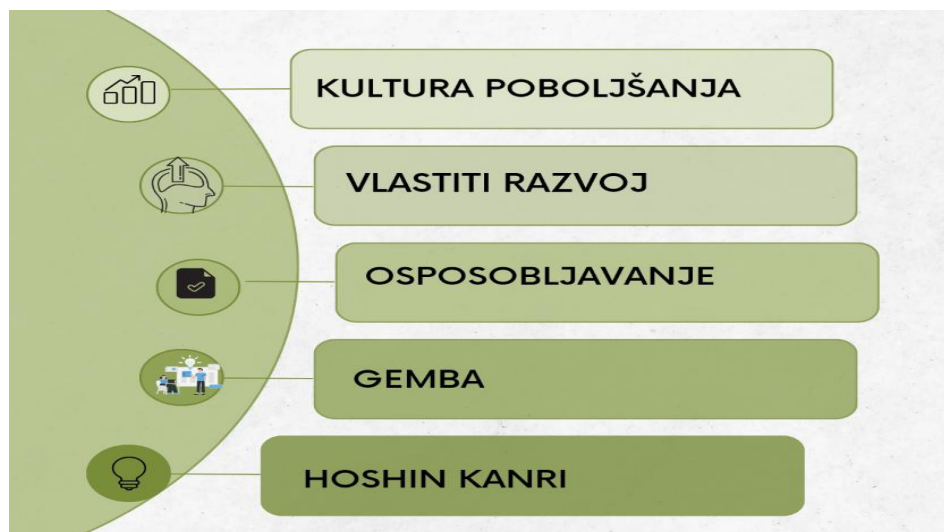
Slika 2. Pet načela vitkog sustava vodstva