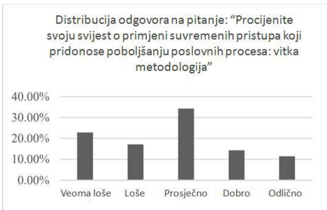
Grafikon 3. Prikaz distribucije odgovora na pitanje o procjeni vlastite svijesti o primjeni suvremenih pristupa poboljšanja– vitke proizvodnje u poduzeće