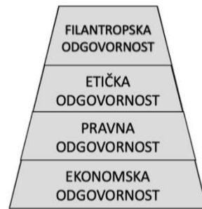
Slika 1.: Piramida društvene odgovornosti prema Carrollu