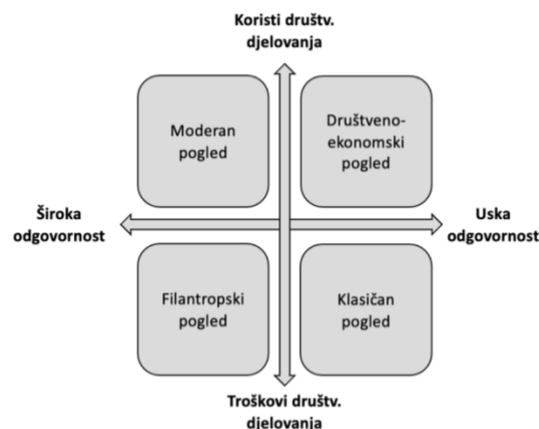
Slika 2.: Dvodimenzijski model društvene odgovornosti poduzeća prema Quaziu i O'Brienu

Quazi i O'Brien (2000.) modelom dvodimenzijske društvene odgovornosti poduzeća podijelili su stavove poduzeća u četiri kategorije odnosno kvadranta koristeći vodoravnu i okomitu os. Vodoravna os predstavlja usku i široku odgovornost: uska se fokusira na maksimizaciju profita bez društvene uloge, dok široka uključuje i širu ulogu u društvu. Okomita os prikazuje kratkoročne troškove društvenog djelovanja nasuprot dugoročnoj dobrobiti koja nadmašuje te troškove. Klasični pogled naglašava maksimizaciju dobiti, tretirajući društveno djelovanje kao neto trošak. Društveno-gospodarski pogled priznaje da društvena odgovornost može donijeti koristi poput usklađenosti s propisima i poboljšanih odnosa, čak i s fokusom na profit. Moderni pogled prepoznaje i kratkoročne i dugoročne koristi društveno odgovornih djelovanja za tvrtku i društvo. Filantropski pogled uključuje širi osjećaj društvene odgovornosti, gdje se tvrtke bave dobrotvornim aktivnostima, često vođene altruističkim ili etičkim motivima. Prema Dathe i suradnicima (2022.) snaga dvodimenzionalnog modela društvene odgovornosti poduzeća leži u jasnoj definiciji korporativne strategije društvene odgovornosti poduzeća, koja je prije svega određena dvjema faktorima – uskoj ili širokoj odgovornosti i koristima ili troškovima društvene odgovornosti poduzeća. Model je prikazan na slici 2.