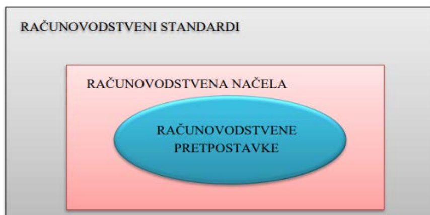
Slika 1 Odnos računovodstvenih pretpostavki, načela i standarda

Prema slici 1, postavlja se zaključak kako računovodstvena načela proizlaze iz računovodstvenih pretpostavki, a računovodstveni standardi iz definiranih računovodstvenih načela.