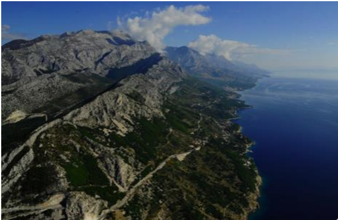
Slika 4 Park prirode Biokovo

Biokovo je planinski lanac koji izranja iz mora pružajući sa svojih vrhova i sjenica nezaboravne panoramske poglede na Makarsku rivijeru i okolice Biokova. 38