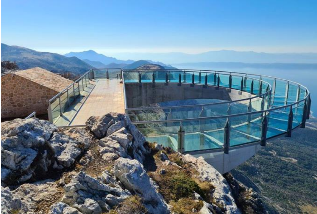
Slika 5 Vidikovac Nebeska šetnica - Skywalk Biokovo

Velika vrijednost Biokova je kulturna baština. Vidikovac Nebeska šetnica - Skywalk Biokovo je prva nebeska šetnica u Hrvatskoj. Polukružnog je oblika promjera 8.5 metara, zajedno s ravnim dijelovima izlazi izvan ruba litice oko 11 metara. 39