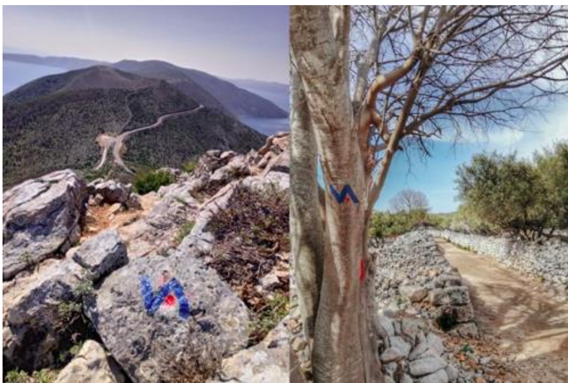
Slika 2 Projekt Via Apsyrtydes – otok Lošinj

Otok Lošinj od 2016. godine sudjeluje u natjecanju „100 najboljih održivih destinacija“. Godine 2022. godine Lošinj je uvršten u top 100 održivih destinacija svijeta. Uz Lošinj svakako valja spomenuti projekt Via Apsyrtydes. Riječ je o sustavu pješačkih obilaznica koje povezuju i prezentiraju prirodne i kulturne atrakcije otočja. 33