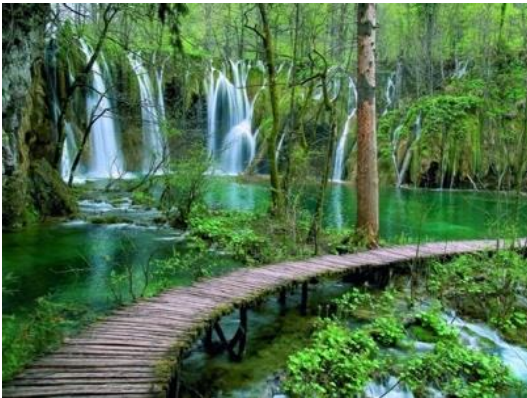
Slika 1 NP Plitvička jezera

„...Plitvice su jedinstven prirodni biser neponovljiv na bilo kojem meridijanu ili paraleli planeta Zemlje...“ 29 Plitvice su najveći nacionalni park u Hrvatskoj. 30