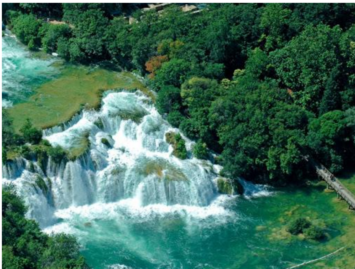
Slika 3 NP Krka

Nacionalni park Krka nalazi se otprilike 75km od Zadra, a u svom većem dijelu smješten je na području Šibensko-kninske županije. 36