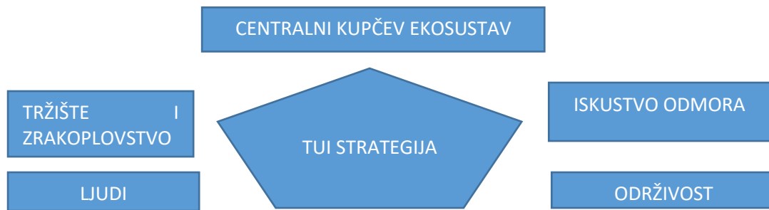
Slika 3. Strategija rasta TUI grupe