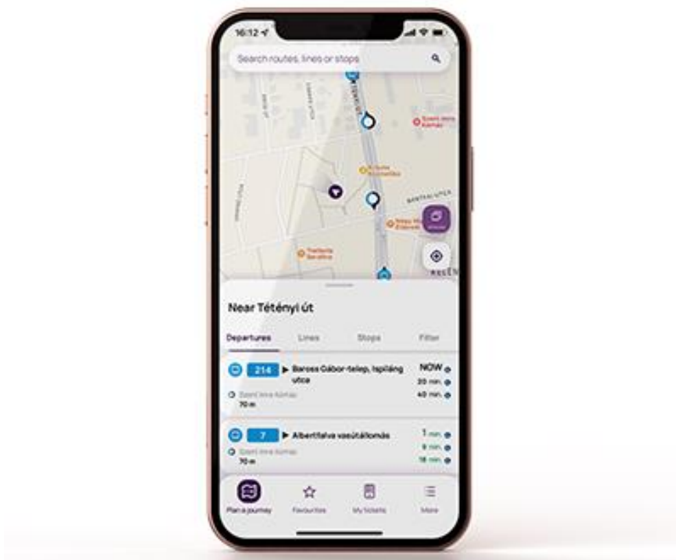
Slika 3 Sučelje aplikacije BudapestGO