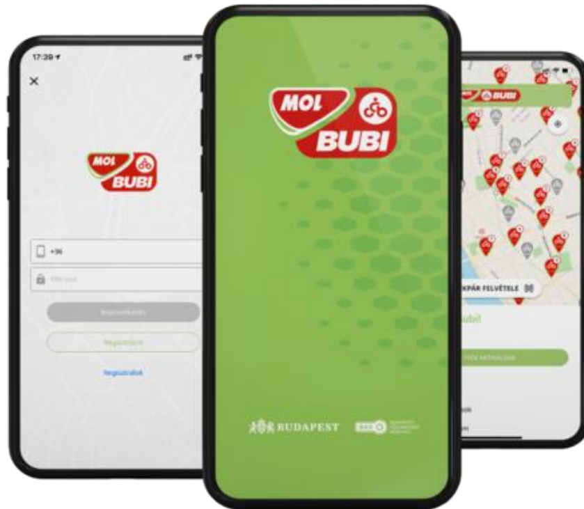
Slika 2 Sučelje aplikacije MOL Bubi