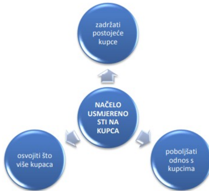
Slika 1. Načelo usmjerenosti na kupca