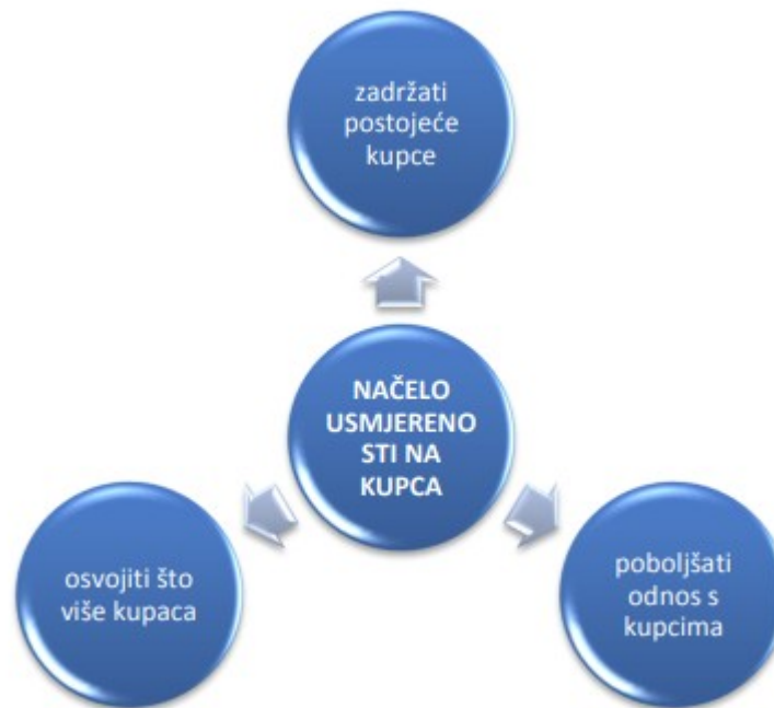
Slika 1. Načelo usmjerenosti na kupca