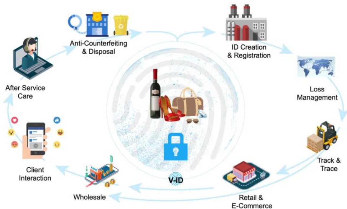
Slika 2. Digitalizacija proizvoda visoke vrijednosti