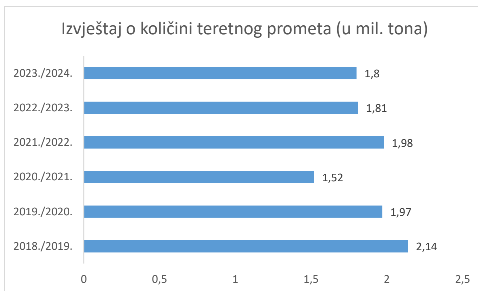
Slika 1 - Izvještaj o količini teretnog prometa u zračnoj luci Changi