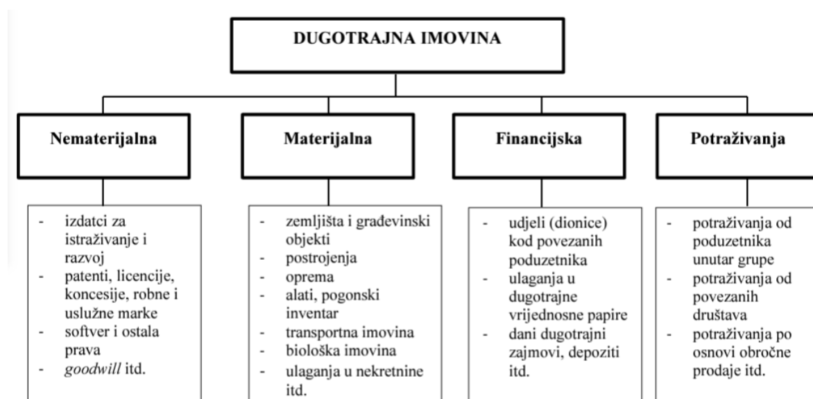
Slika 1. Struktura dugotrajne imovine