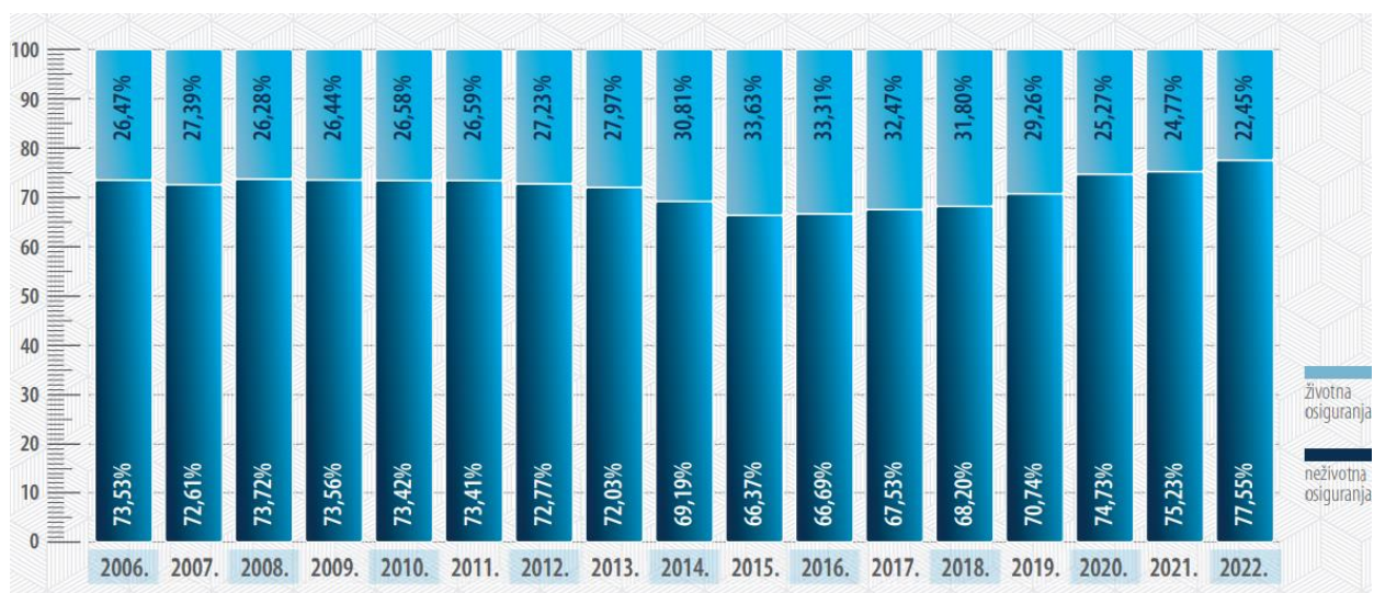
Tablica 2: Udio neživotnih i životnih osiguranja u ukupnoj ZBP za razdoblje 2006.-2022. godine