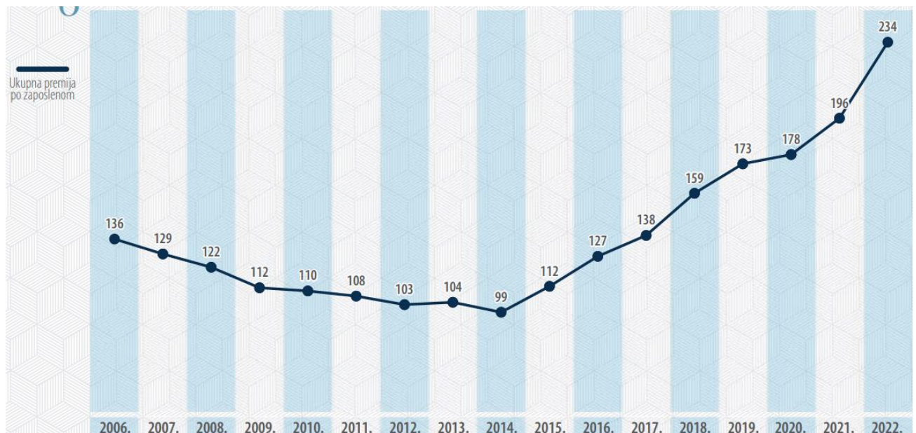
Tablica 3: Premija po zaposlenom u periodu od 2006. do 2022. godine

Sljedeća tablica prikaz je premije po zaposleniku za period od 2006. do 2022. godine. Premija po zaposlenoj osobi za razdoblje 2022.godine iznosila je 234 tisuće EUR, dok je broj zaposlenika u društvima za osiguranje iznosio ukupnih 7.185 zaposlenika. Premije po zaposleniku postepeno doživljavaju rast od razdoblja 2003. do 2005. godine, dok bi u početnom periodu 2006. godine bilježili stalnu stopu pada do 2014. godine. 2014. godine dolazi do porasta ukupne premije po zaposleniku, kao jedan od čimbenika uspješnosti poslovanja društva za osiguranje. Dok se broj zaposlenika u društvima za osiguranje uvelike smanjuje, uz blagi porast u 2021. godini. Tržišna kretanja, konsolidacije nekih društava za osiguranje, racionalno upravljanje troškovima, promjena u distribucijskim kanalima i digitalizacija poslovanja utjecali su na ovaj srednjoročan snažan trend smanjenja broja zaposlenih. Ostaje za vidjeti na koji će način daljnja digitalizacija poslovanja, novi distribucijski kanali te zakonske odredbe zastupanja i posredovanja utjecati na kretanje broja zaposlenih u osiguranju.