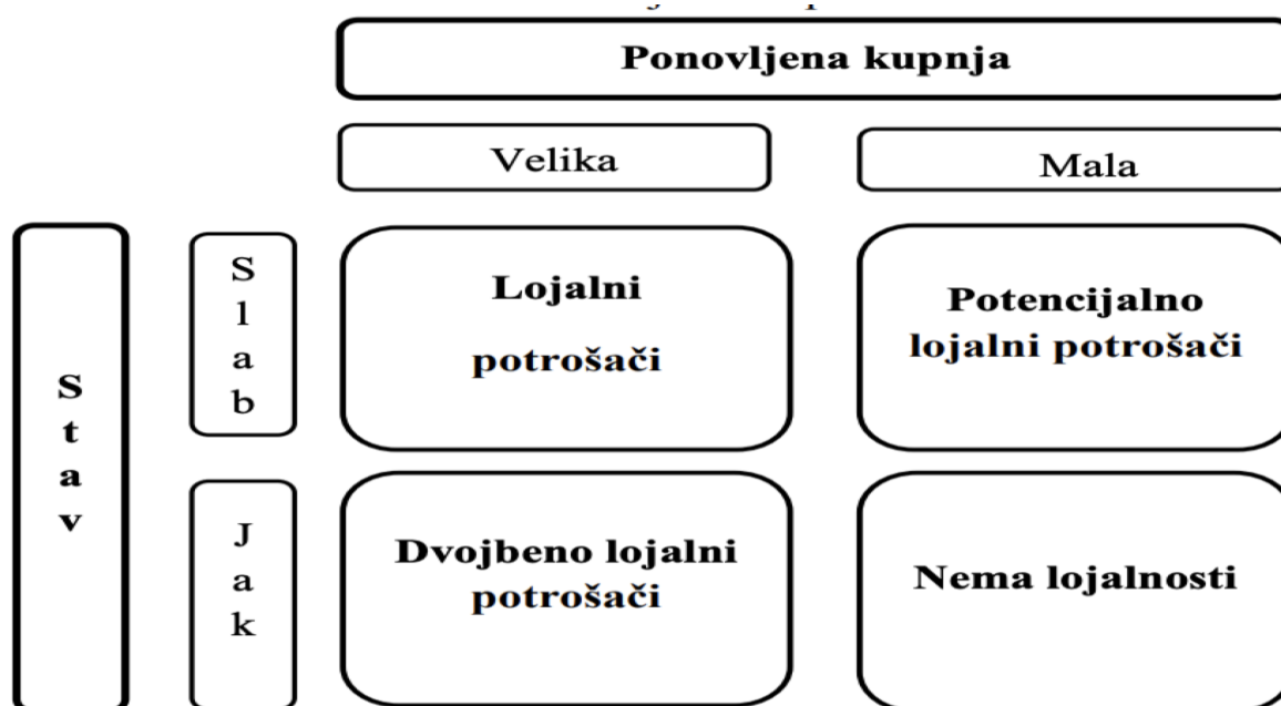
Slika 3.1. Dvodimenzionalnost lojalnosti