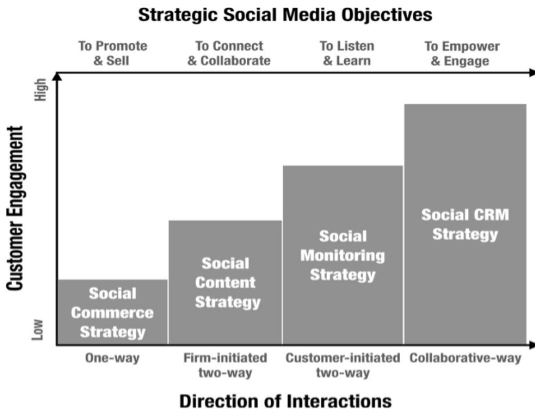
Slika 1 Taksonomija strategija marketinga na društvenim medijima