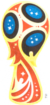
Slika 2. Logotip SP-a