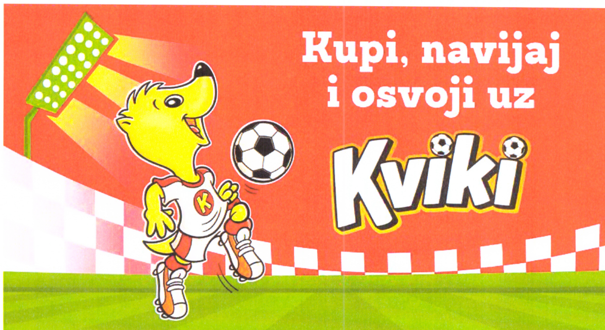
Slika 4. Kviki 2018.