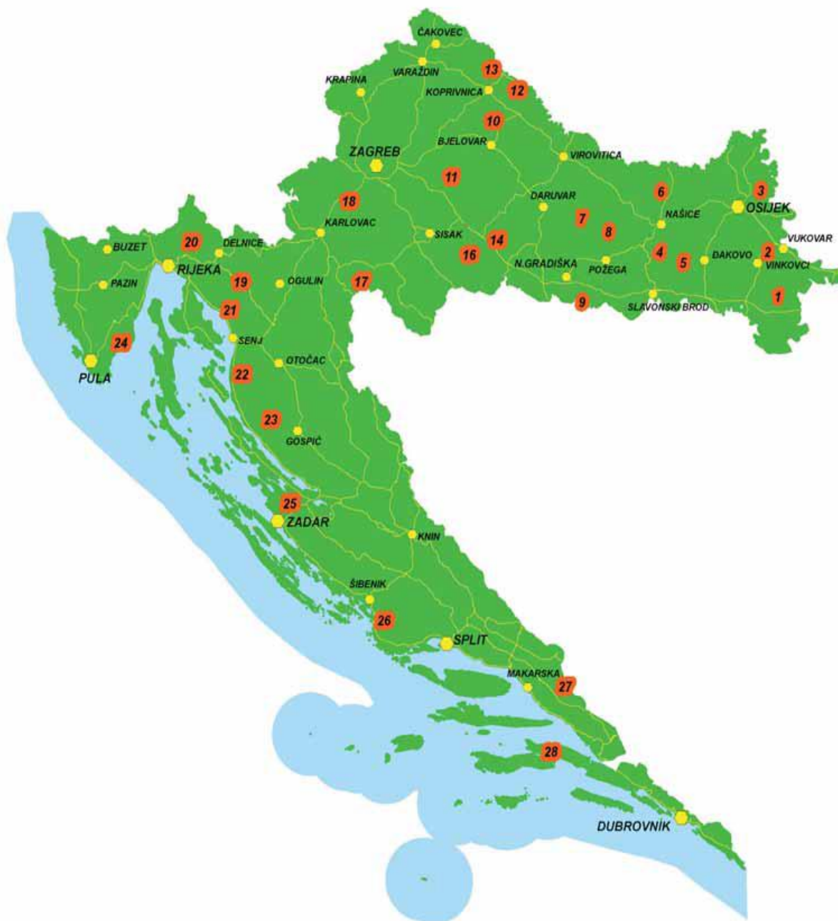
Slika 1. Lovišta u Republici Hrvatskoj