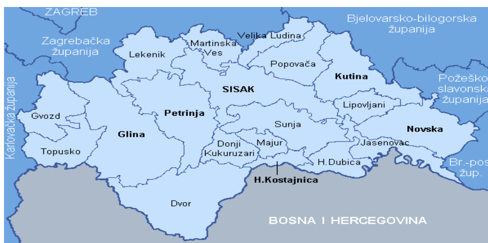
Slika 2. Sisačko-moslavačka županija