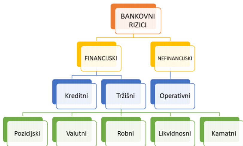
Slika 1. Podjela rizika u bankarskom sektoru